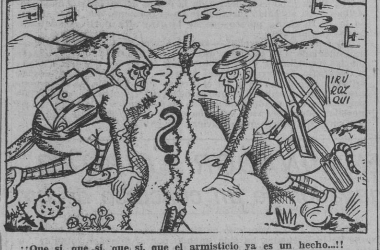
¡Que sí, que sí, que sí, que el armisticio ya es un hecho...! ¡Que no, que no, que no, que si se hizo será deshecho...!