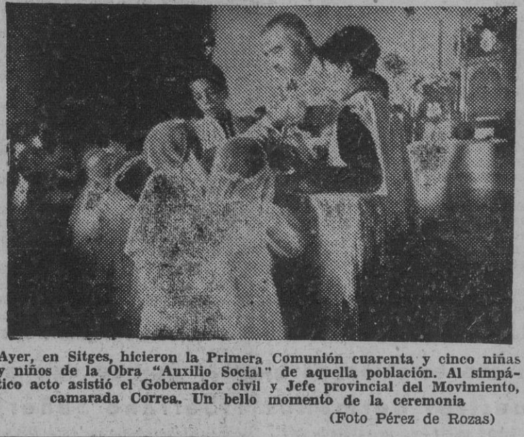
Ayer, en Sitges, hicieron la Primera Comunión cuarenta y cinco niñas y niños de la Obra "Auxilio Social" de aquella población.