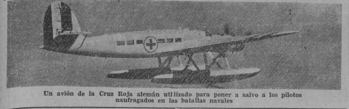
Un avión de la Cruz Roja alemán utilizado para poner a salvo a los pilotos naufragados en las batallas navales