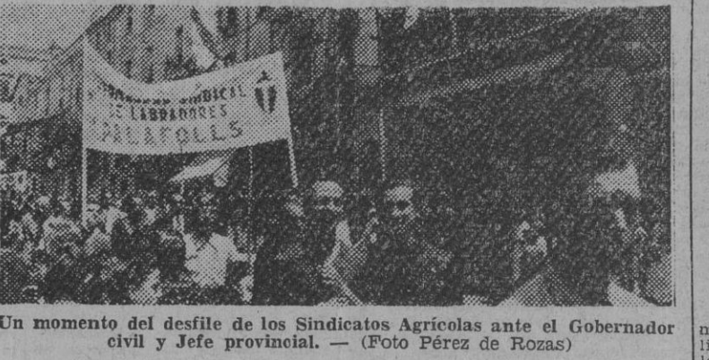
Un momento del desfile de los Sindicatos Agrícolas ante el Gobernador civil y Jefe provincial.