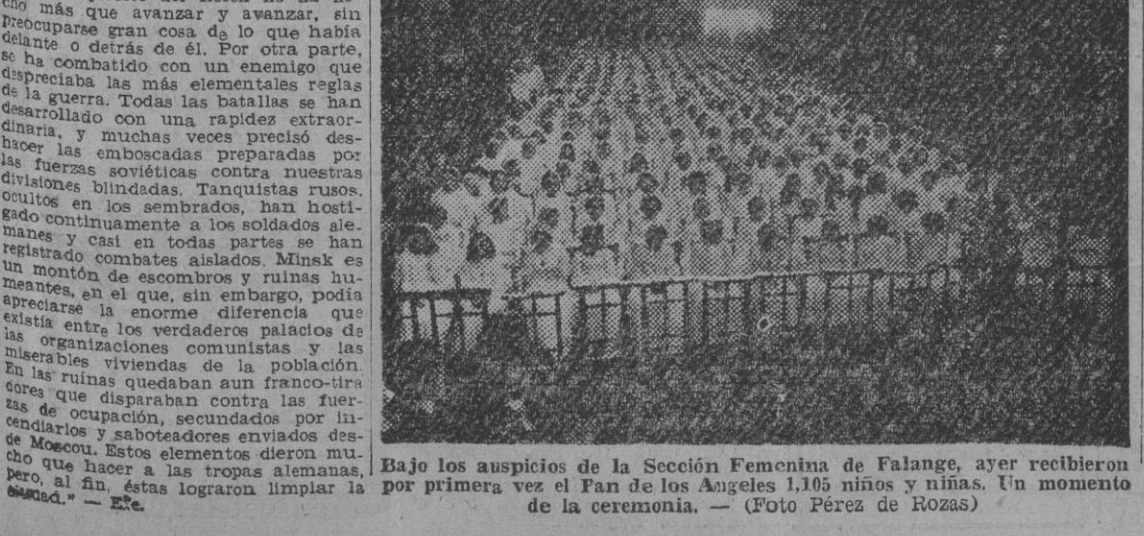
Bajo los auspicios de la Sección Femenina de Falange, ayer recibieron por primera vez el Pan de los Angeles 1.105 niños y niñas. Un momento de la ceremonia.