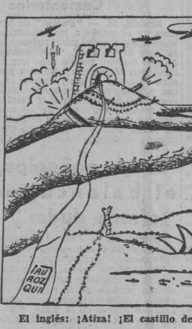
El inglés: ¡Atiza! ¡El castillo de Irak; pero no volverá!...