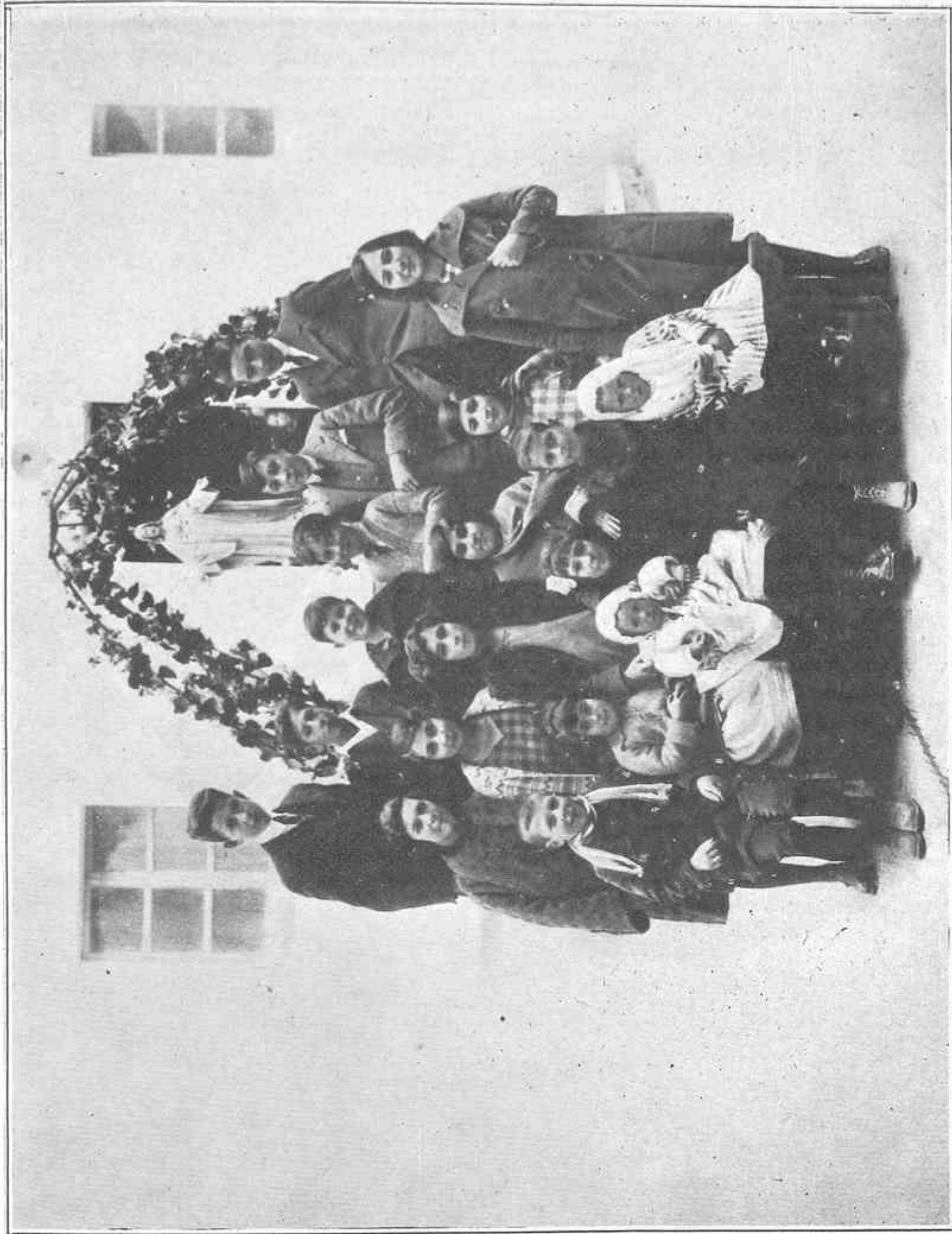
Los seis niños bautizados con sus madrinas y padrinos. Fotografía obtenida después de tan hermoso acto, en el patio de las Religiosas Salesianas.