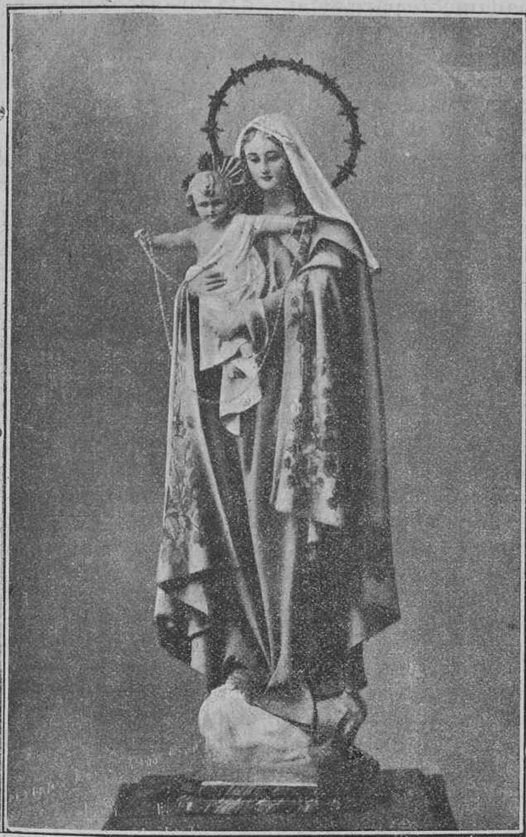
LA VIRGEN DEL ROSARIO

arca de la alianza , donde se guarda el “maná escondido”, que se reserva para los vencedores, junto con la