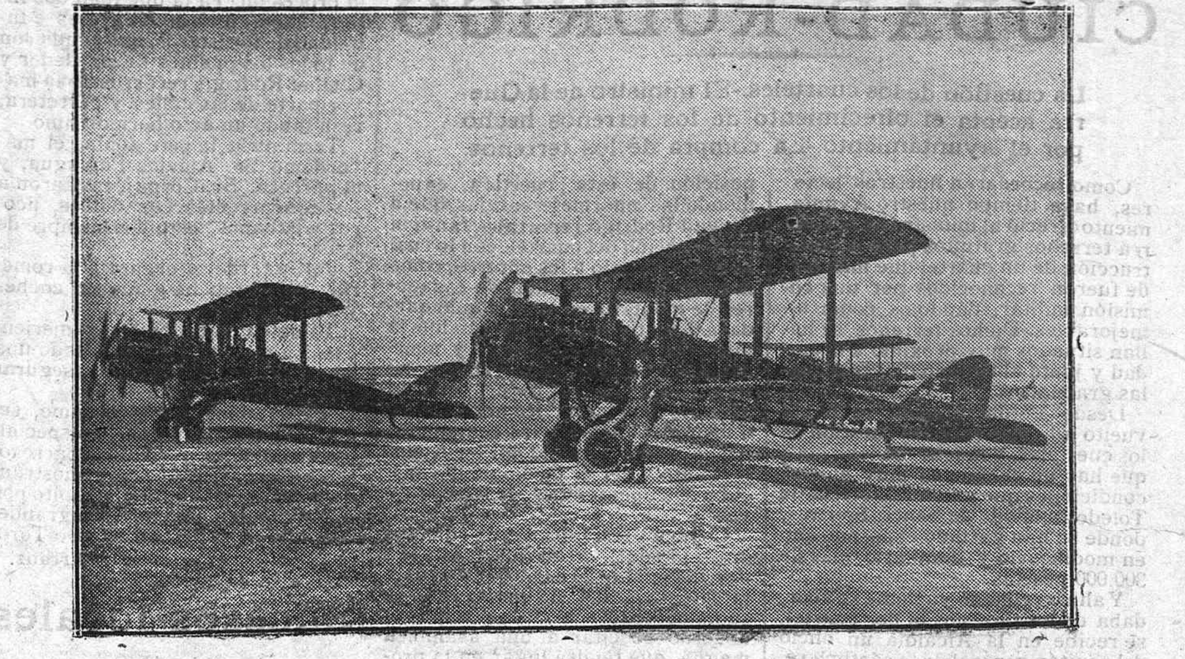
Los aeroplanos Salamanca I y Salamanca II en Cuatro Vientos, después de ser bendecidos.