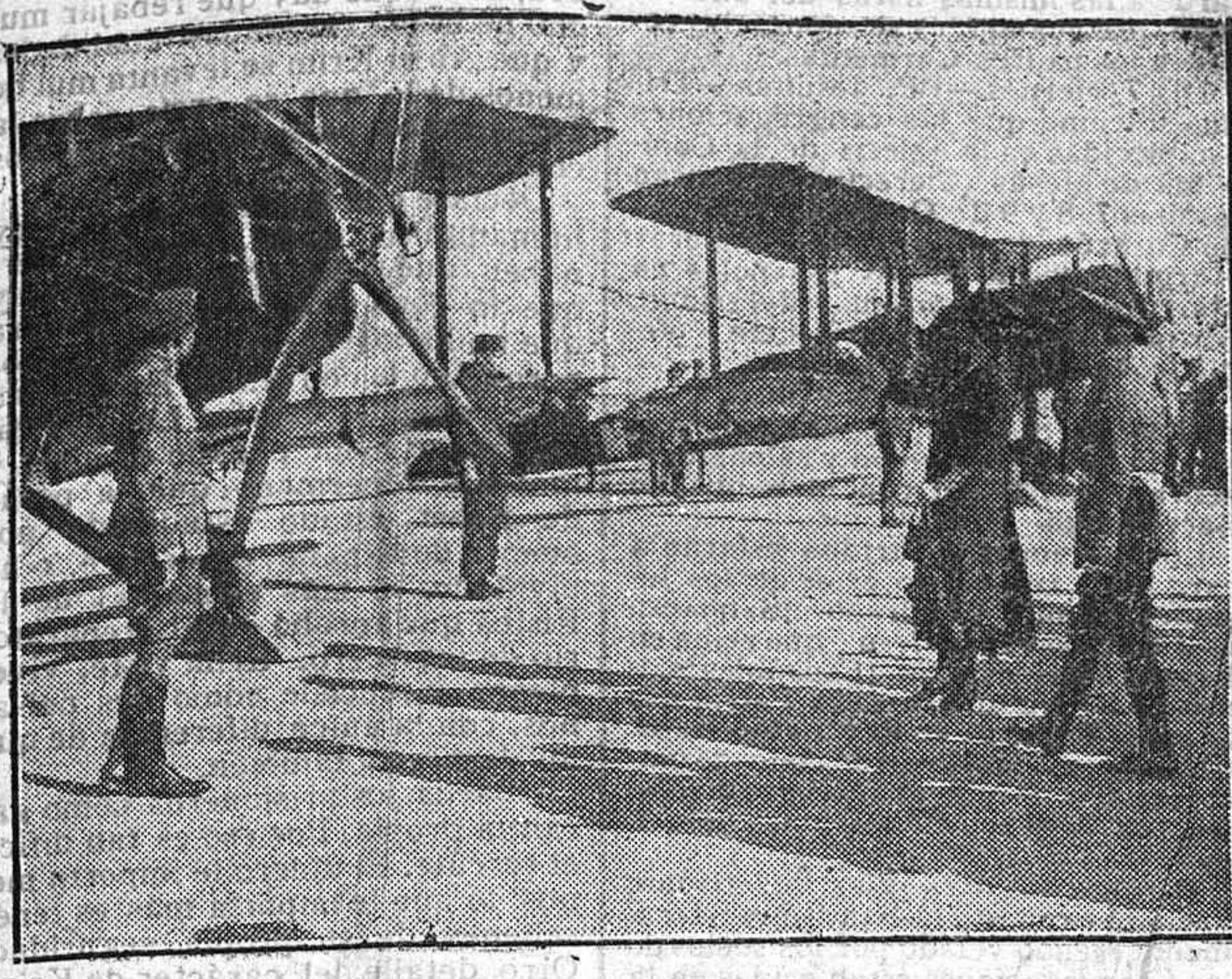
Su Majestad la Reina D. a Victoria tirando de la cinta que sujeta, junto al tornillo de la hélice, la botella de champagne con que bautizó los aeroplanos Salamanca.