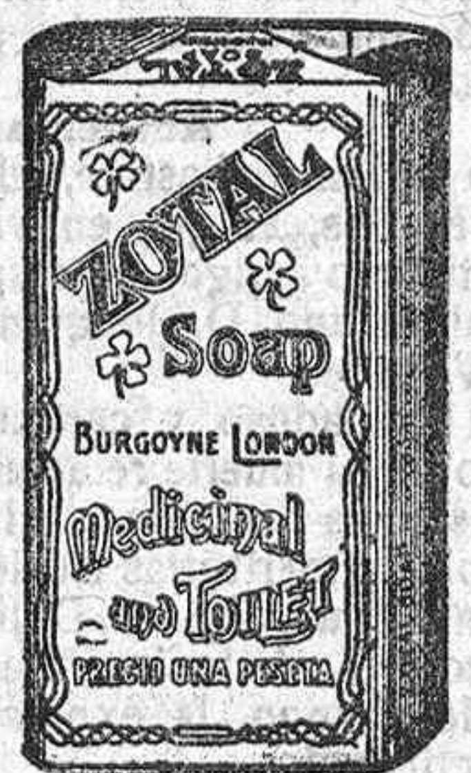
Envase del JABON ZOTAL

EL MEJOR DESINFECTANTE PARA LA HIGIENE - CURA LAS ENFERMEDADES DEL GANADO, VIÑAS, PLANTAS Y ARBOLES FRUTALES - INDISPENSABLE PARA COMBATIR LA LANGOSTA - CON SU USO SE EVITAN LAS ENFERMEDADES CONTAGIOSAS