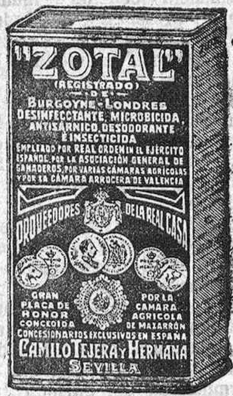
Nuevo envase del ZOTAL

Aparatos sanitarios. - Vidrio plano. - Arcas para caudales. - Básculas, etc. CORRILLO, 4 Y 6 - SALAMANCA