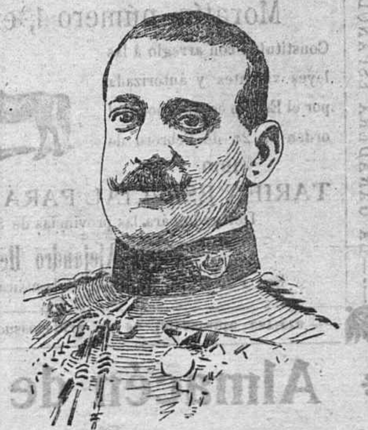
General Martínez Anido.

La noticia del ingreso en el generalato del coronel director de la Academia de Infantería señor Martínez Anido, ha causado el mejor efecto en los centros