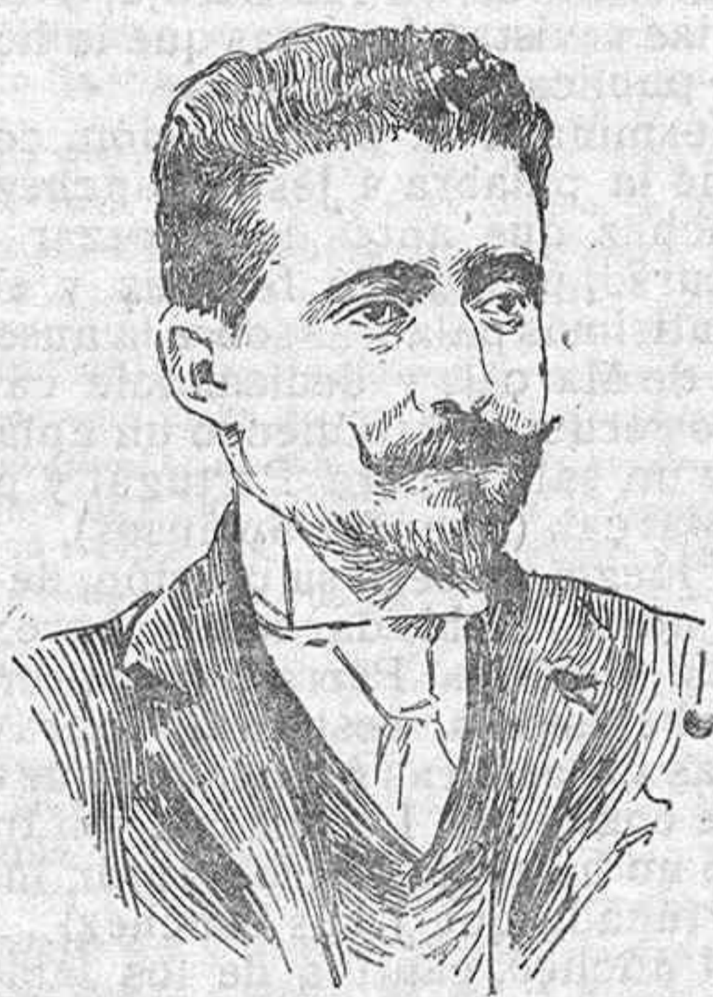
Don Alfonso Costa, jefe del partido radical, nuevo presidente del Consejo de ministros de la vecina República.

La Dirección general ha enviado una circular á todo el personal de Telégrafos de España, por la que se invita á que manifiesten quiénes desean pasar á prestar sus servicios en las plazas de Africa, cubriendo dos vacantes de directores de segunda clase y varias de oficiales terceros y quintos.