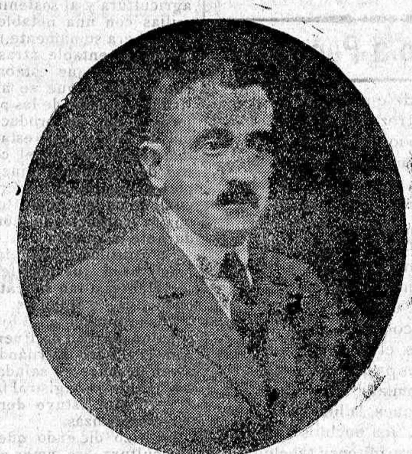
D. ANGEL BENITO PARADINÁS Alcalde de Salamanca.