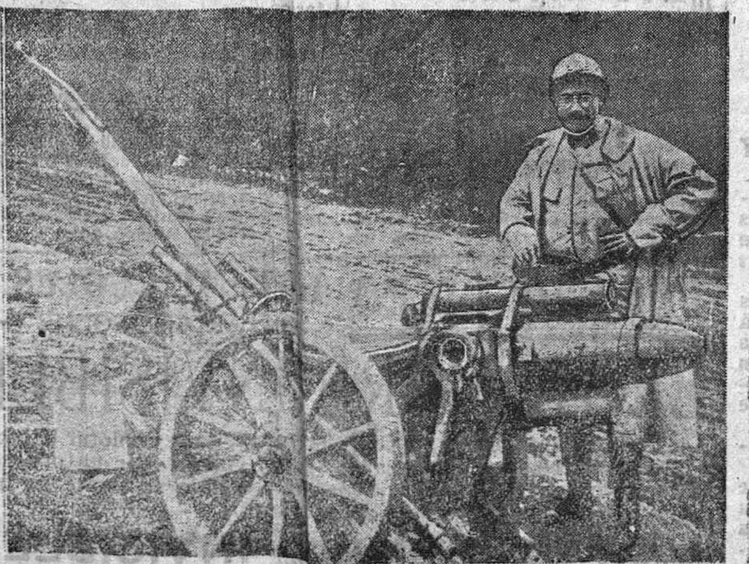
Notas gráficas de la guerra. Escavadora tracción a vapor.