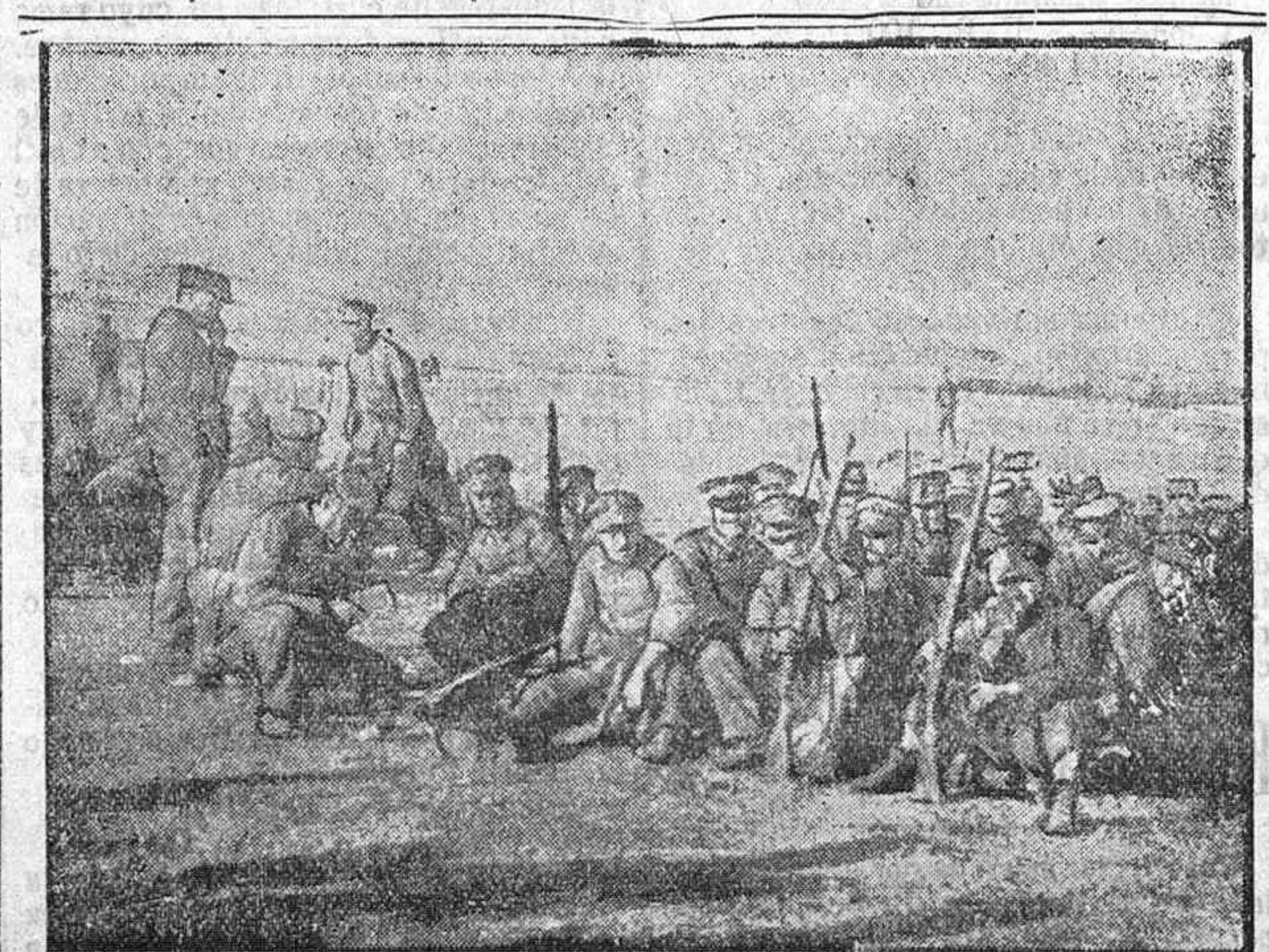
Notasgráficas de la guerra.—Patrulla de soldados griegos.—(Foto-Infomacion).

Vacas holandesas.—Se venden para parir en todas las épocas del año: diez novillas de primer parto, dando treinta cuartillos de leche cada una, y un cocho de dos ruedas con toldilla, con guarniciones ó sin ellas. Para informes, Gonzalo Rodríguez, Tejares, Huerta del Sr. Madrugá.