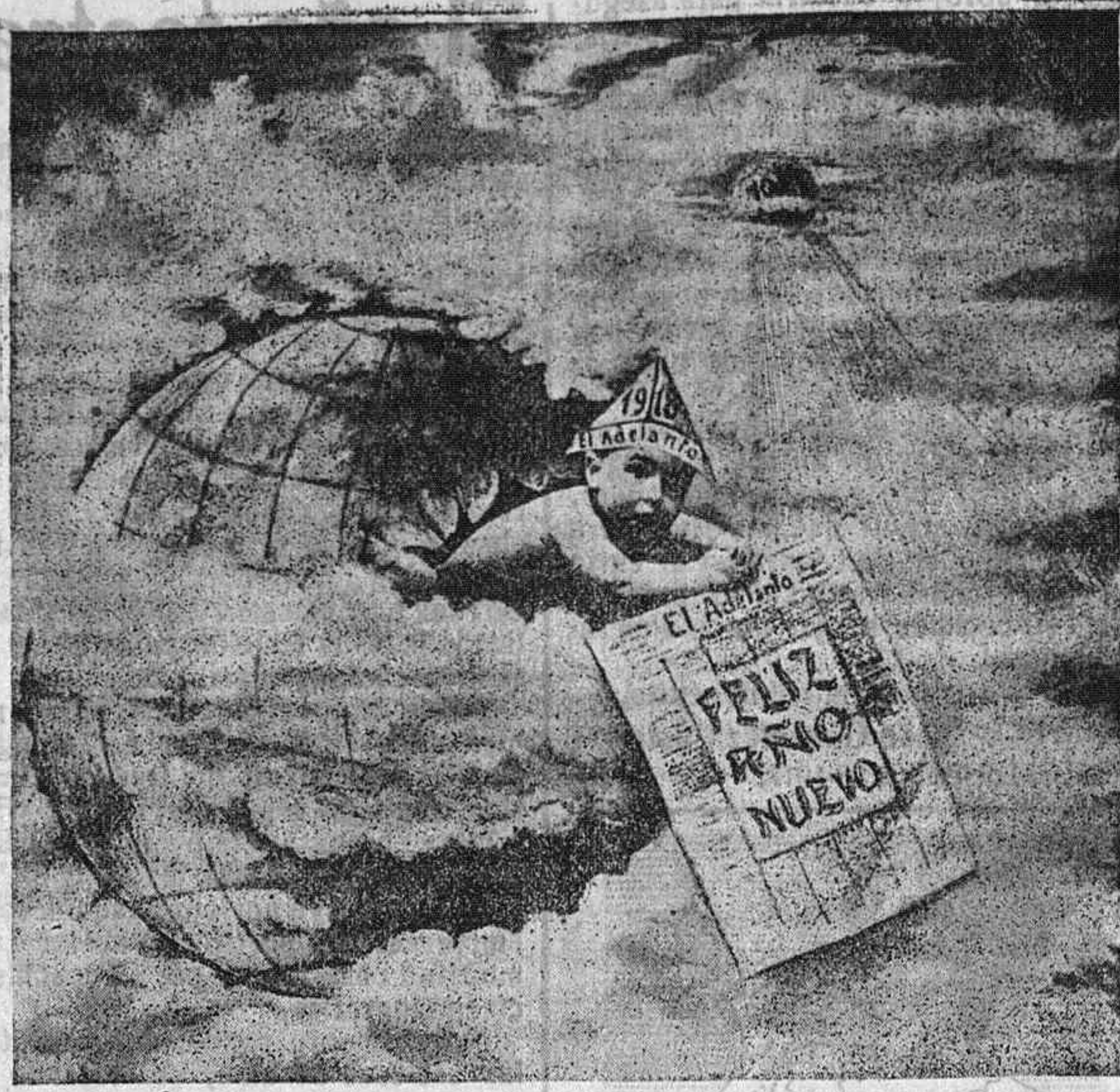
Composición fotográfica de la casa Ansedé y Juanes.