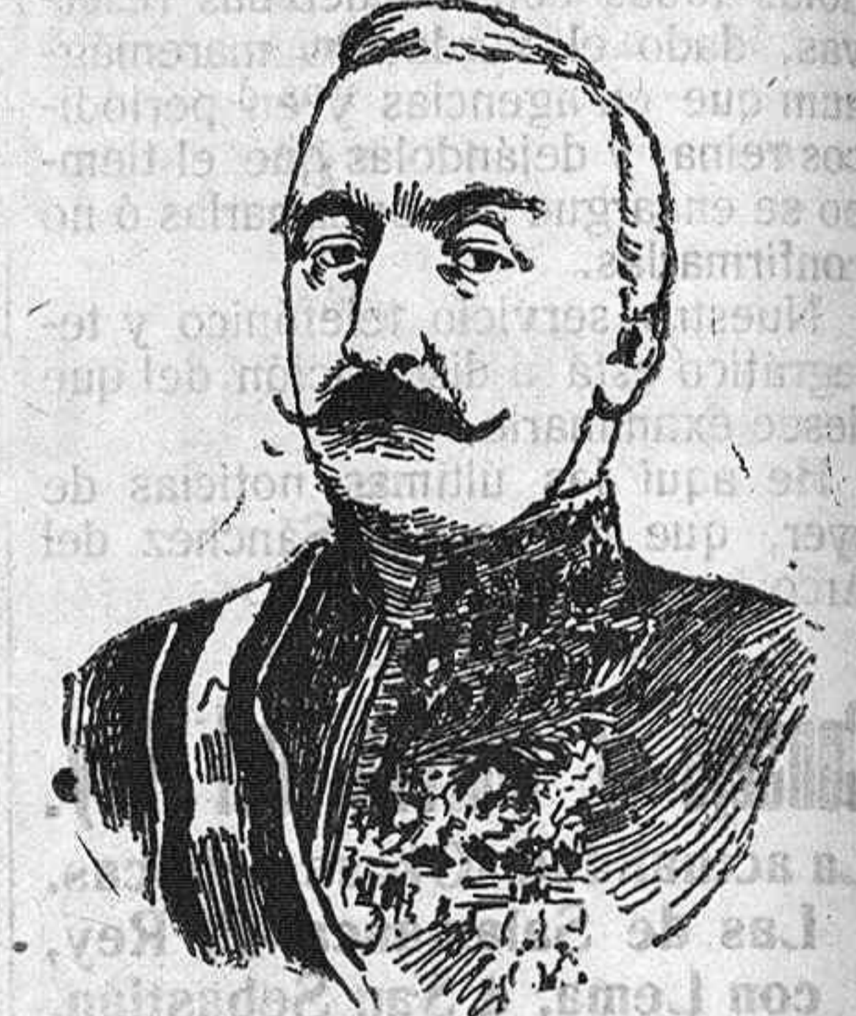
El presidente de la República Argentina, señor Saenz Peña, fallecido el lunes último.