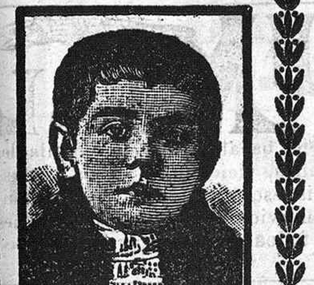
Portrait of a man, likely related to the Scott's Emulsion advertisement.

Según las publicadas de Real orden de 1886, las llamadas medidas y pesas de Castilla, son en el sistema métrico: 1 fanega de aridos, 55,501 litros. 1 cántara ó arroba de vino, 16,138.