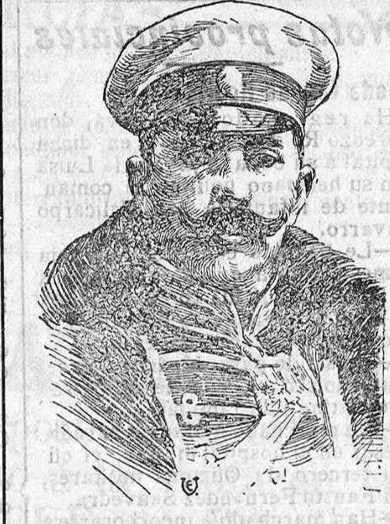
Don Jaime de Borbón.

El heredero de don Carlos de Borbón, su hijo don Jaime, acaba de dirigir á los que militan en sus bande-