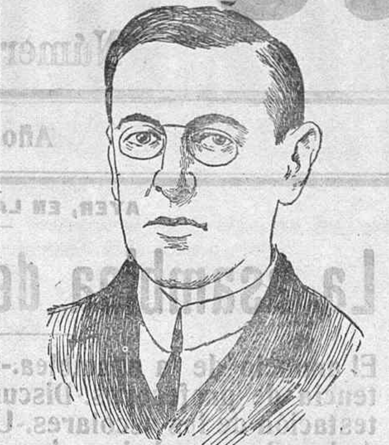
Mr. Wilson, nuevo presidente de los Estados Unidos de Norte-América.