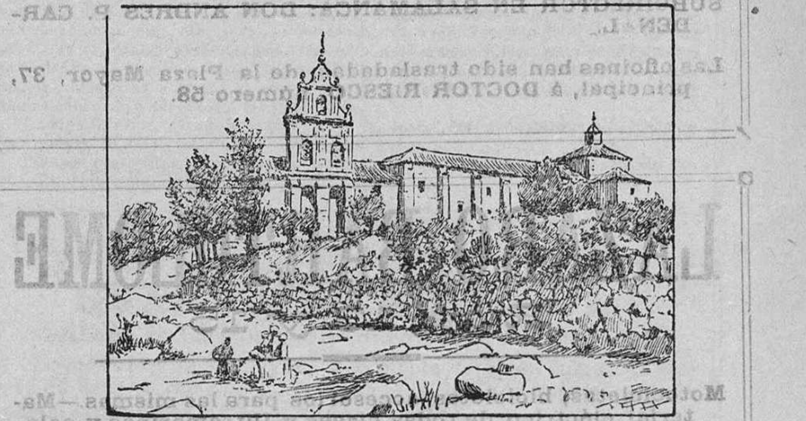
Convento de la Encarnación, en Avila, donde estuvo Santa Teresa