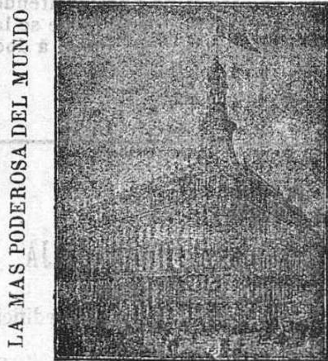
LA MAS PODEROSA DEL MUNDO