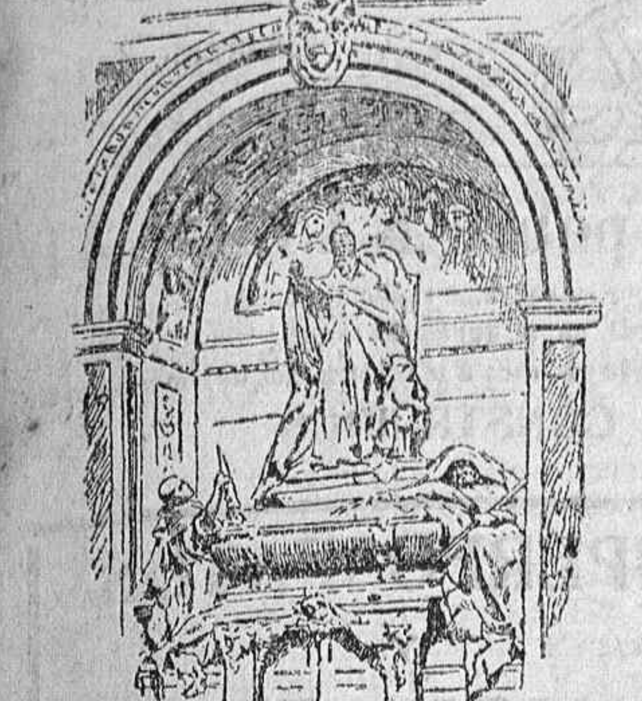
Sepulcro definitivo de León XIII en la Basílica lateranense.

Conventos de madres religiosas.—Misas conventuales de seis á las ocho.