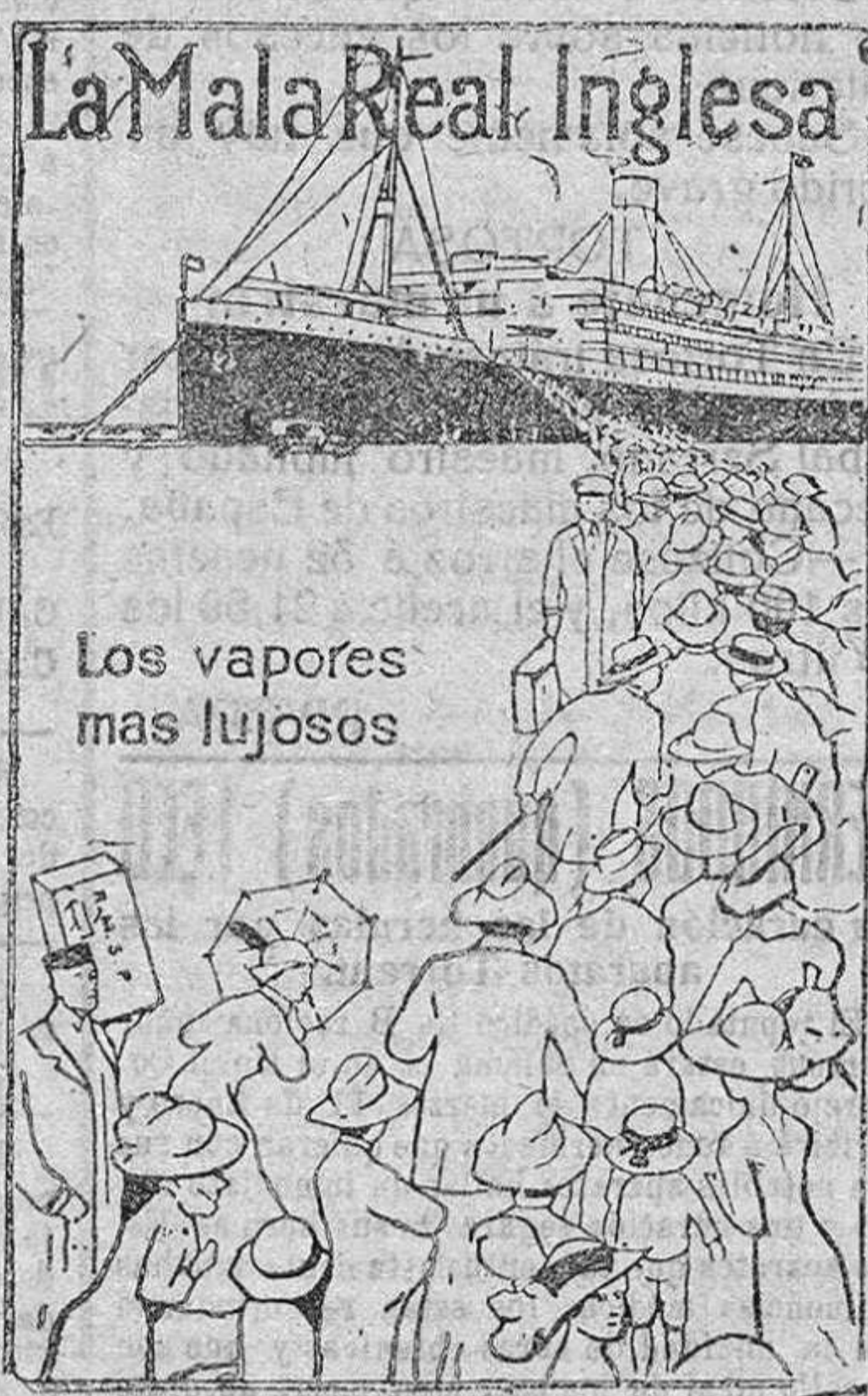
Los vapores mas lujosos

R. M. S. P. SERVICIO RAPIDO PARA PERNAMBUCO BAHIA RIO JANEIRO SANTOS MONTEVIDEO Y BUENOS AIRES