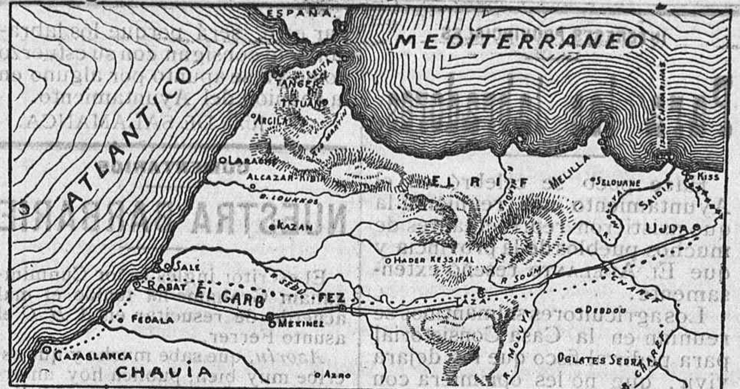
Mapa de las regiones de Marruecos que serán objeto de la intervención.