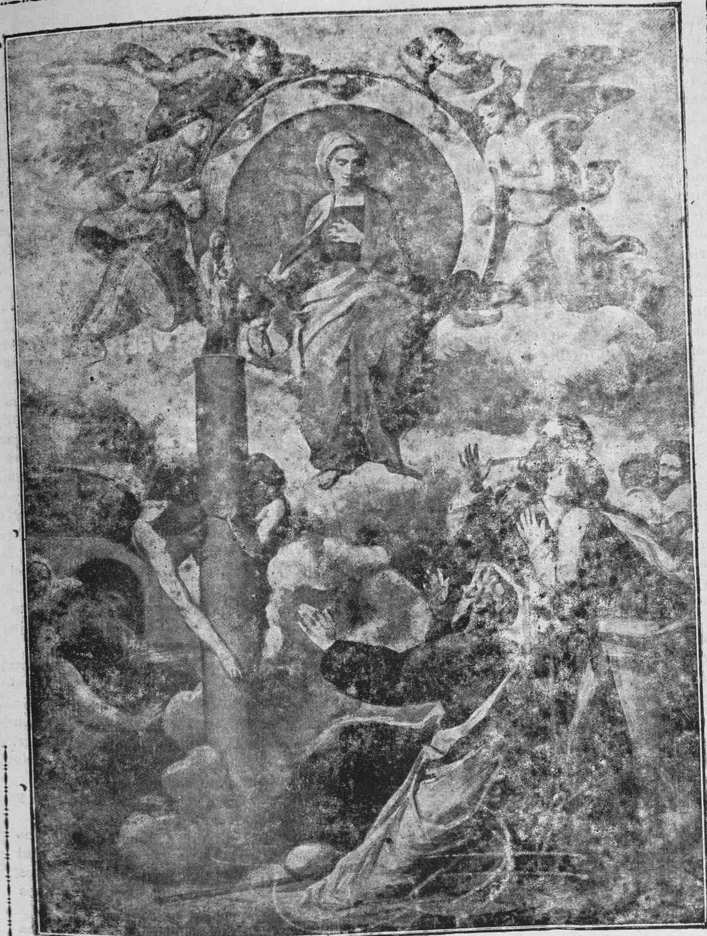
LA VIRGEN DEL PILAR EN ZARAGOZA