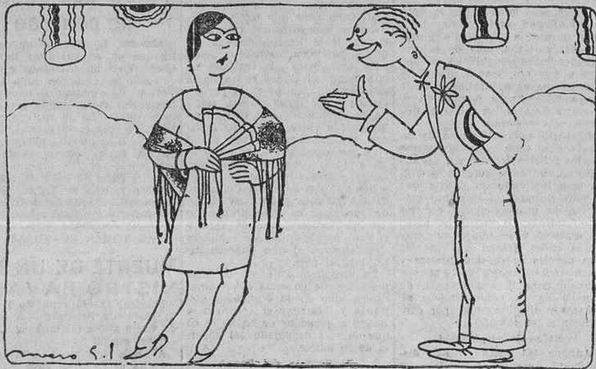
--Señorita: es usted un capricho. --¡Y usted un frescol

Moscú, 13.—En su respuesta a la nota polaca, el Gobierno de los Soviets insiste en afirmar que el asesino del Sr. Wolkoff es de nacionalidad polaca. Pide que en la instrucción del proceso participe un representante soviético, e insiste en la necesidad de que las autoridades polacas ordenen la expulsión de los súbditos rusos adversarios del régimen de los Soviets.