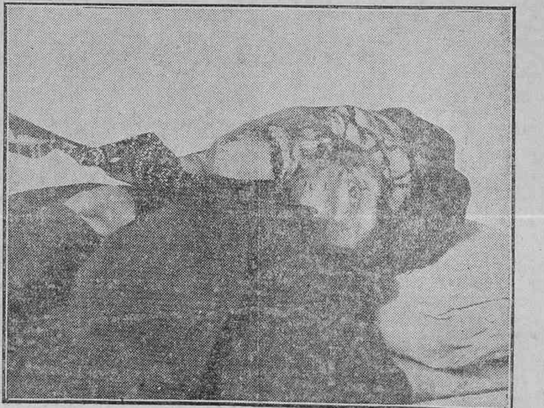
EL SANGRIENTO SUCESO DE ANOCHÉ.—EL CADAVER DEL INDIVIDUO QUE MATO AL JOYERO E HIRIO AL DEPENDIENTE, SUICIDANDOSE DESPUES