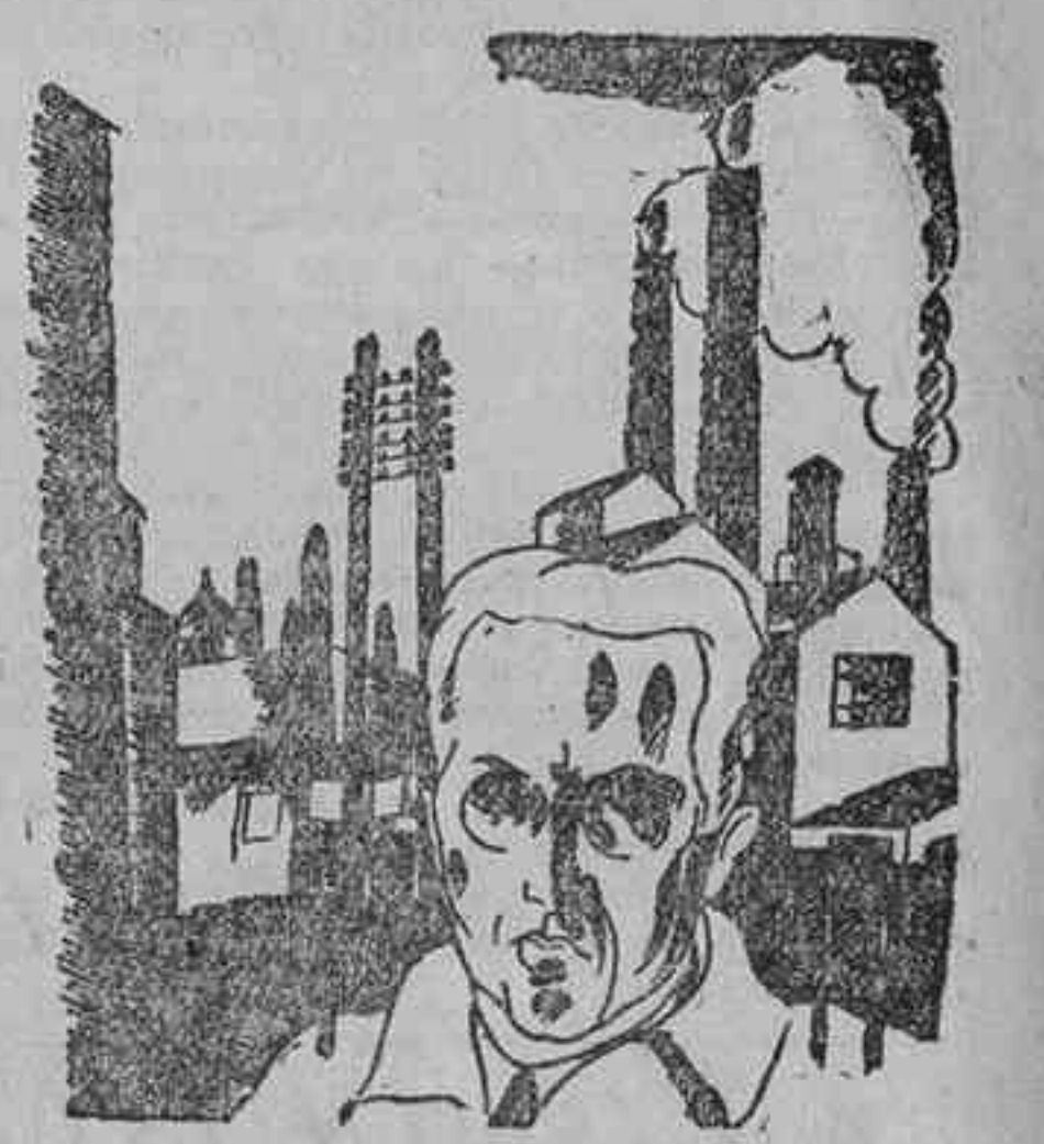
E. Giménez Caballero