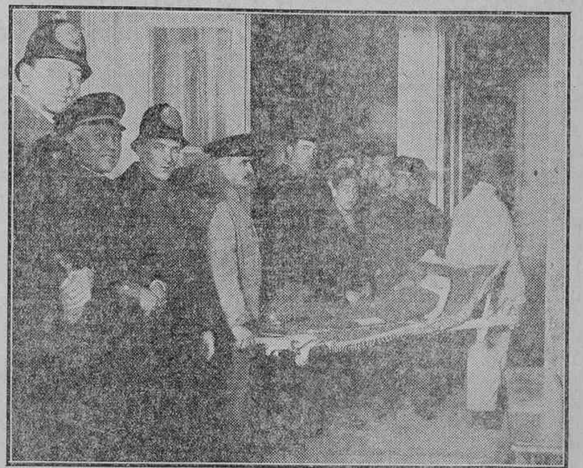
EL SUCESO DE LA JOYERIA.—TRASLADO DE LOS CUERPOS DE LOS PROTAGONISTAS A LA CASA DE SOCORRO DEL DISTRITO DEL CONGRESO

pendir sus tiradas para dar un avance del suceso, que, naturalmente, debido a la forma de desarrollarse y la hora en que tuvo efecto, no pudo ser ni extensa ni precisa. El público todo relacionado este suceso con aquel otro acaecido no ha muchos meses en la Jotería de la calle de Alcalá, número 2. Indudablemente, entre éste de hoy y aquel existe una analogía, en cuanto a la forma de desarrollarse se refiere, y aun acaso la haya en el móvil. Hemos oído muy distintas opiniones sobre la causa originaria de los males sociales y perturbaciones que dan motivo para crear y fomentar delitos de esta índole, aún más cuando en la época actual no pueden atribuirse al juego. El mal radica, sin duda, en otra clase de vicios sociales más perturbadores del organismo y más perjudiciales, por tanto, para la sociedad, y que tal vez tengan su base en determinados establecimientos donde, a base del vino y la mujer, se debilitan los cuerpos y se corrompen las conciencias.