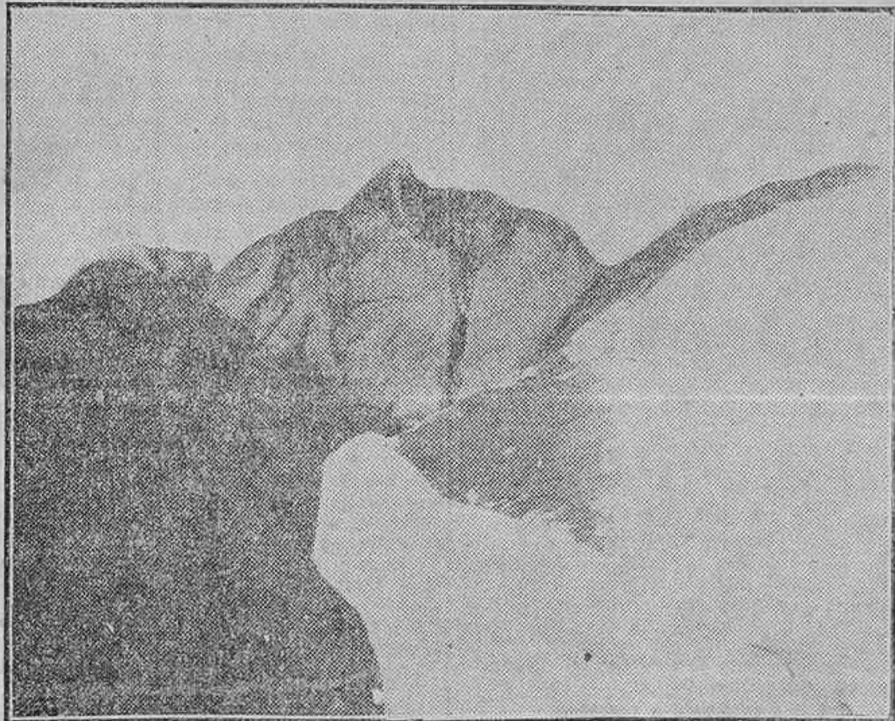
EL SUCESO DE LA CALLE DEL PRINCIPE.—EL CADAVER DEL JOYERO, D. TIBURCIO DORADO, DE LA CUEVA (Fots. Alfonso).

Declaración del individuo que mató al joyero e hiere al dependiente, suicidándose después