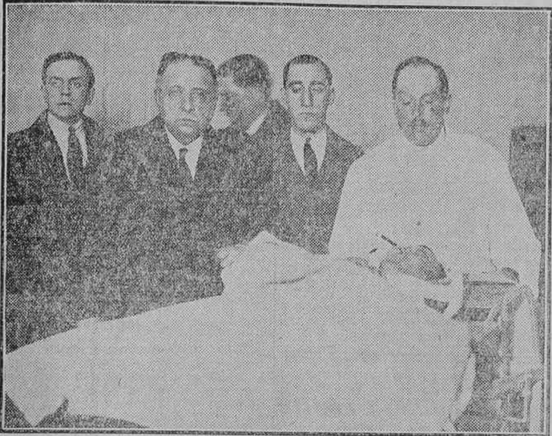
DEL SUCESO DE AYER.—EL JUZGADO DE GUARDIA PRACTICANDO DILIGENCIAS EN LA CASA DE SOCORRO

Dijo que después de haber encerrado el automóvil con que sirve, se dirigía a su domicilio, cuando al llegar a la calle del Príncipe, frente al número 16, sintió voces y algo así como si en el mostrador de la joyería diesen golpes sobre los cierres. Acto seguido vió salir corriendo del