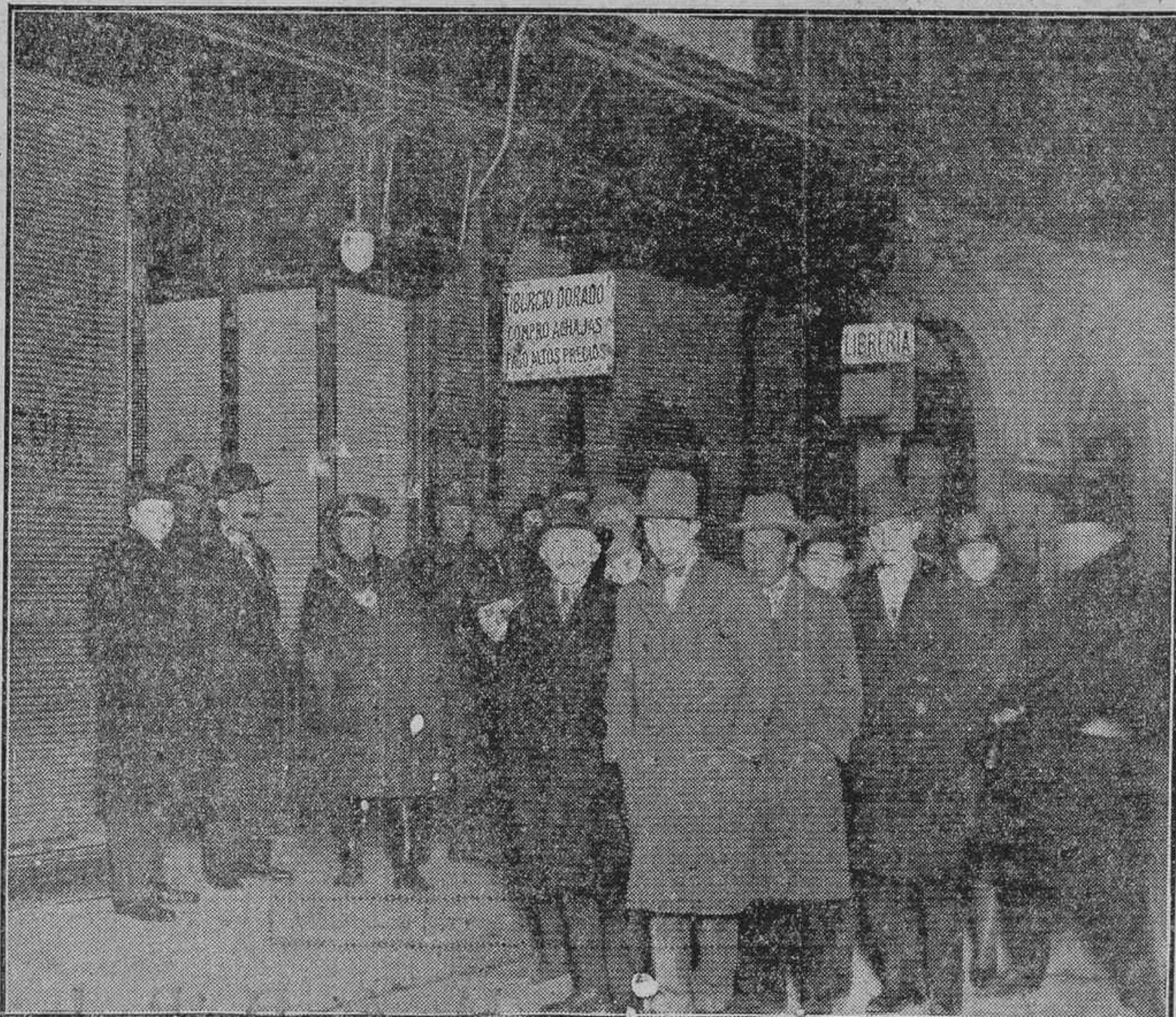
LUGAR-DONDE SE DESARROLLO ANOCHE EL SANGRIENTO SUCESO DEL QUE PUBLICAMOS EXTENSA INFORMACION EN TERCERA PAGINA. LA FOTOGRAFIA ESTA HECHA POR ALFONSO MOMENTOS DESPUES DE Ocurrir EL CRIMEN