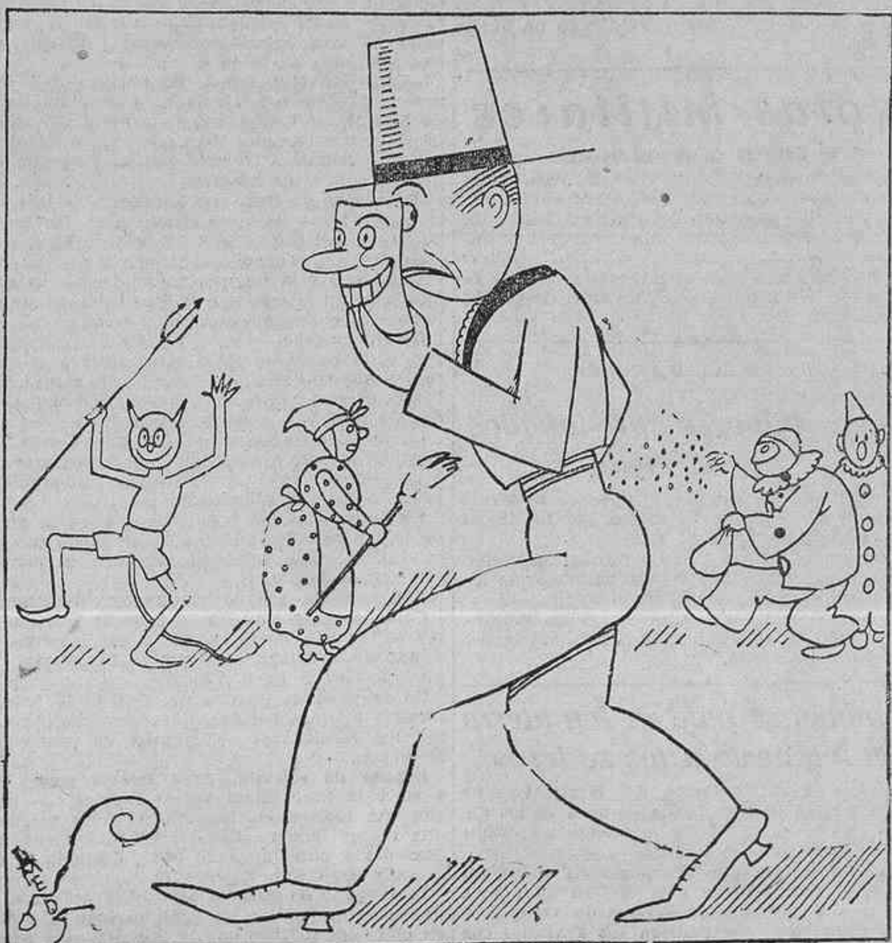
--No hay quien me conozca.