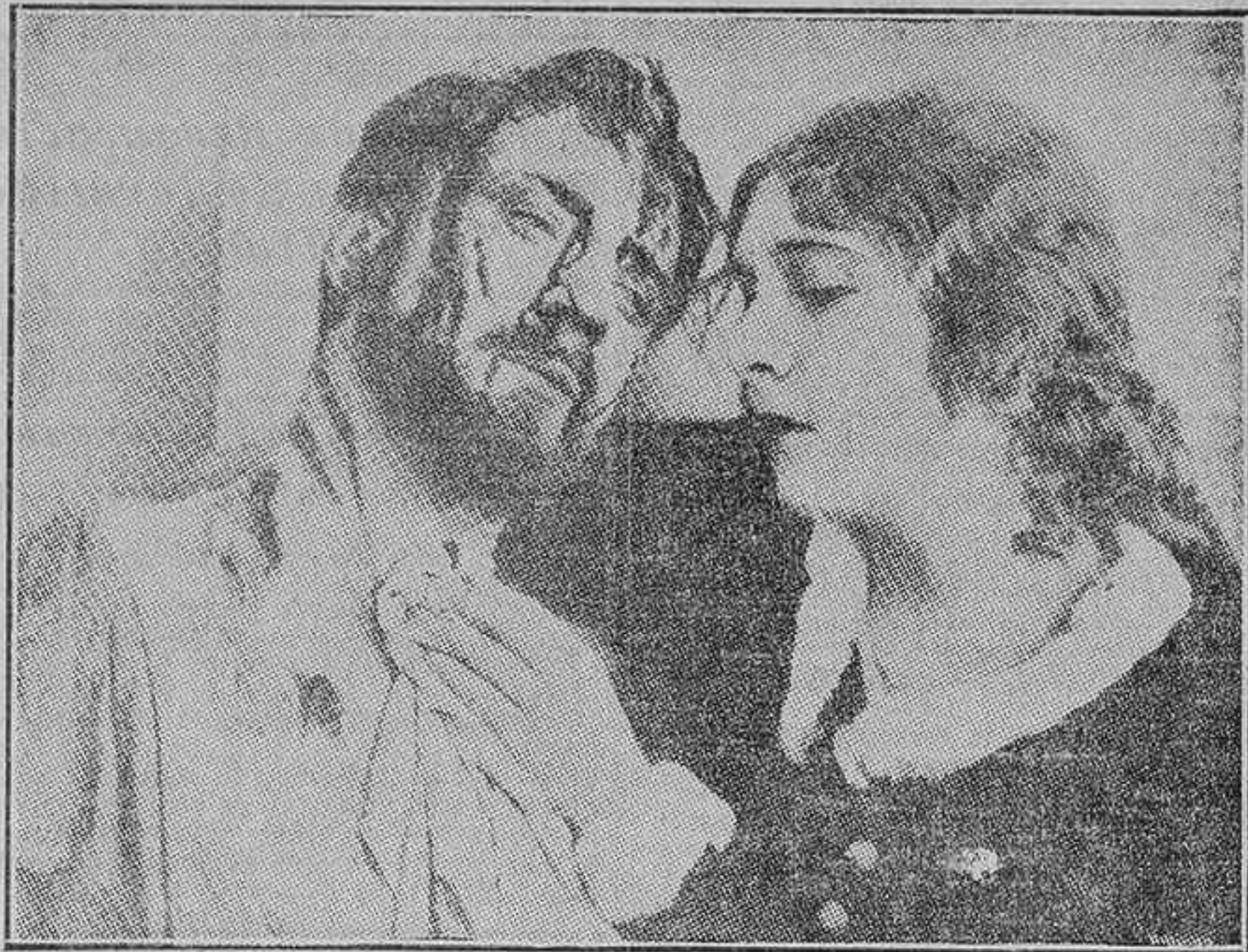
LOS ACTORES RUSOS IVAN MESJOUKINE Y NATALIA KORANKO, EN LA GRANDIOSA CINTA «MIGUEL STROGOFF O EL CORREO DEL ZAR»