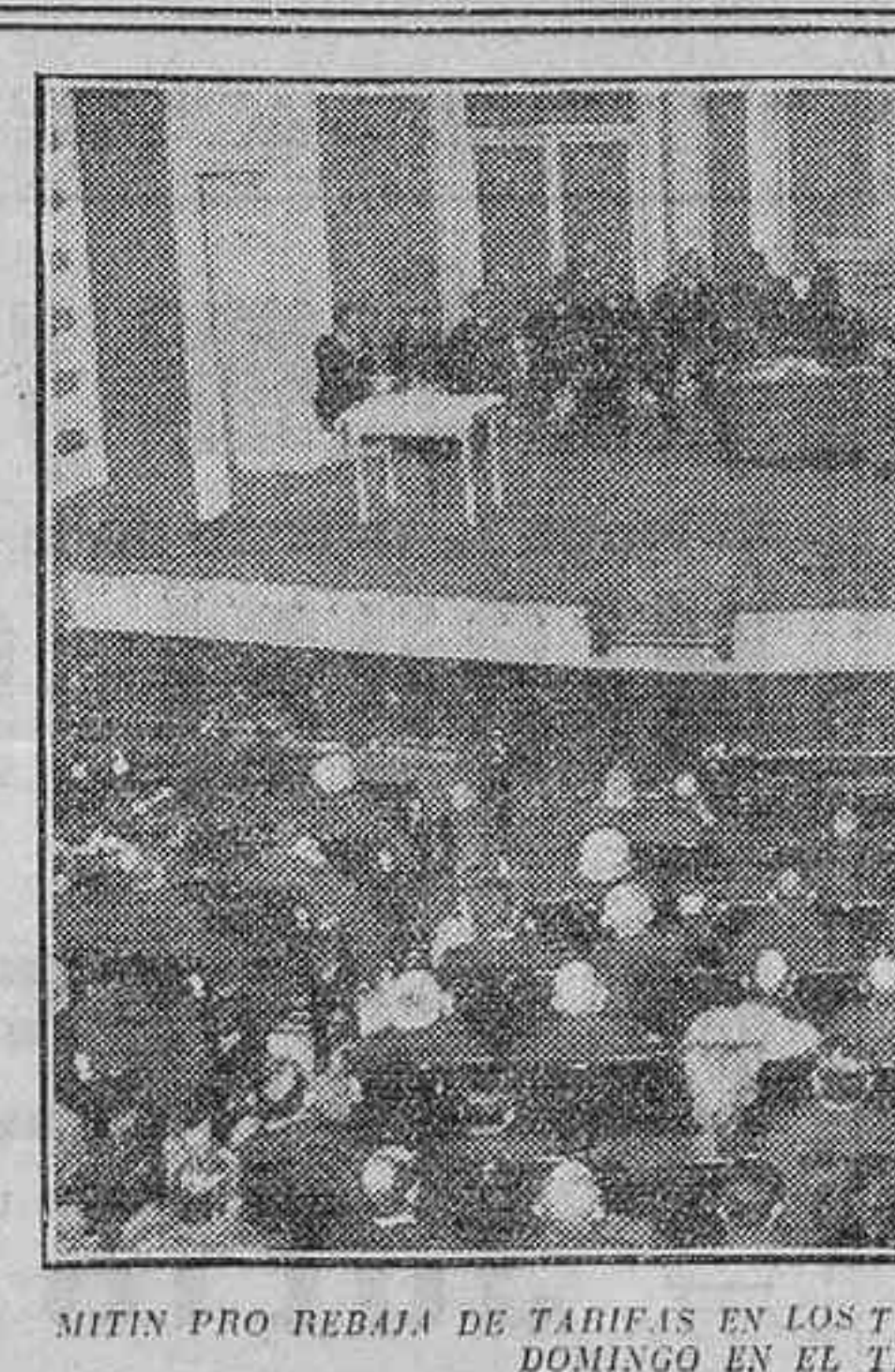
MITIN PRO REBAJA DE TABIFAS EN LOS TRANSPORTES URBANOS, CELEBRADO EL DOMINGO EN EL TEATRO ALCAZAR

En el concurso de becas de reeducación para inválidos del trabajo, anunciado por este Instituto en la «Gaceta» del 2 de Diciembre de 1926, han resultado favorecidos los solicitantes que a continuación se mencionan: