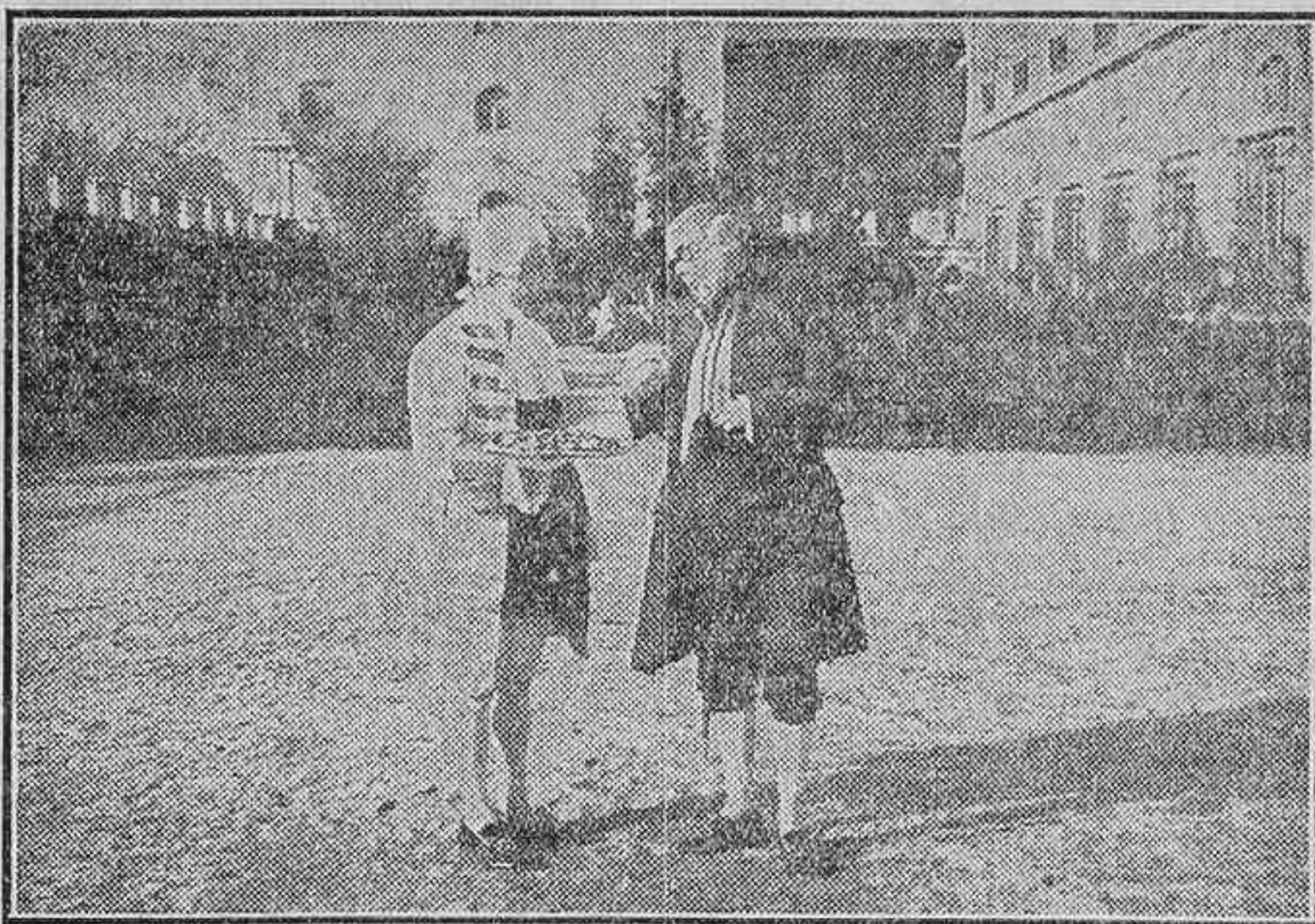
UNA ESCENA DE «EL CONDE DE MARAVILLAS», PELICULA DIRIGIDA POR JOSE BUCHS