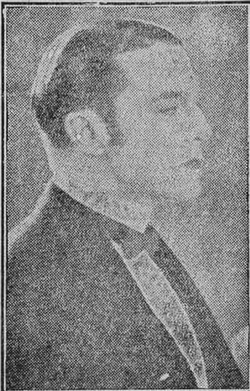
Olive Brook, protagonista de «¡Por la patria!», película de la «Pro-Dis-Co»

Se ha dicho que en el arte la sobriedad es una de las cualidades más raras y difíciles. Ser sobrio en la escena, es dado únicamente a los grandes actores. Clive Brook es la sobriedad misma. En el hermoso drama mudo de espionaje y amor «¡Por la patria!» hay un difícilísimo «role» que sólo podía encomendarse a