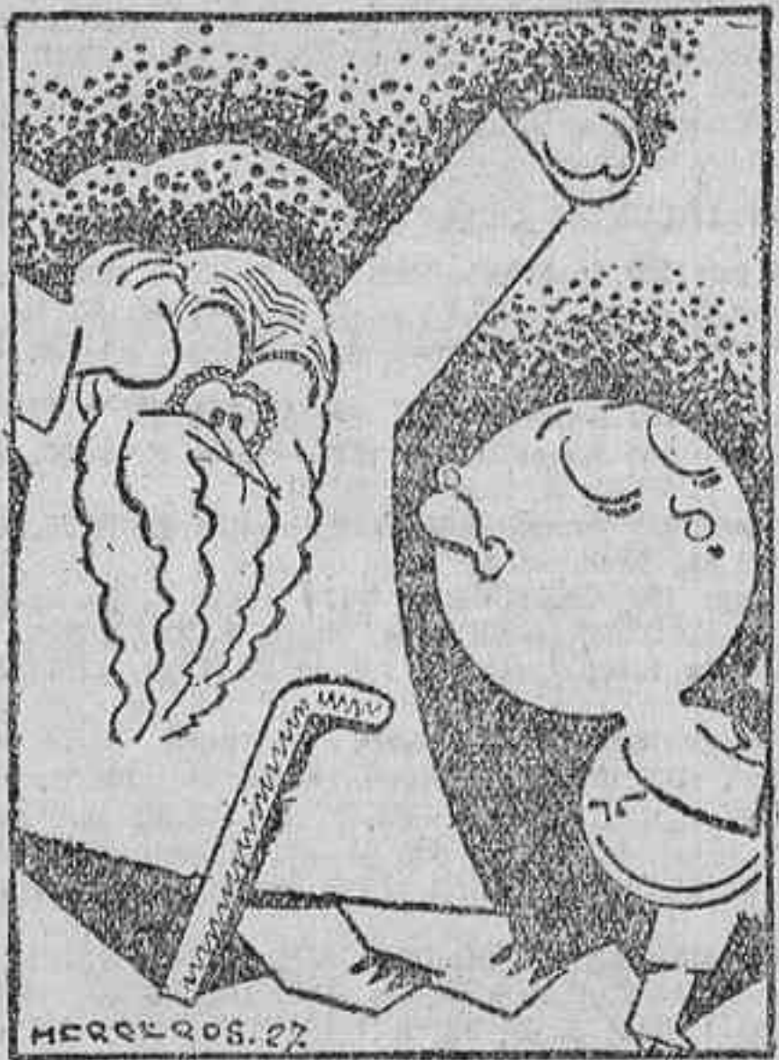
El hombre de experiencia.—¿Has visto ese borracho que ha pasado? ¡Oh, tierna criatura que ignoras aún lo que es el vicio!...