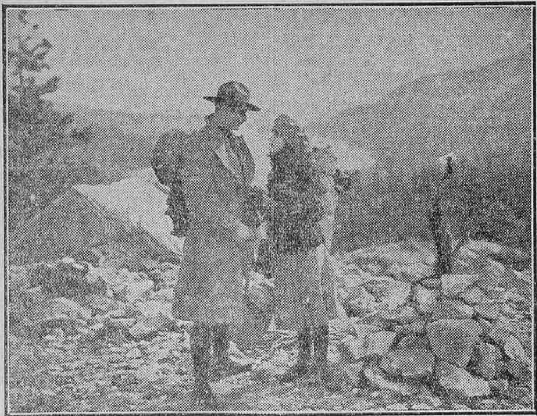
MARCELINE DAY Y NORMAN KERRY EN LA PELICULA DE LA METRO GOLDWYM, «LA BARRERA»