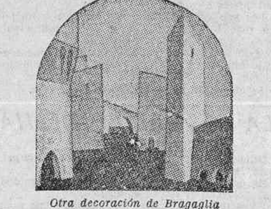
Otra decoración de Bragaglia.

La «Fiera Letteraria» se ha apresurado a co-