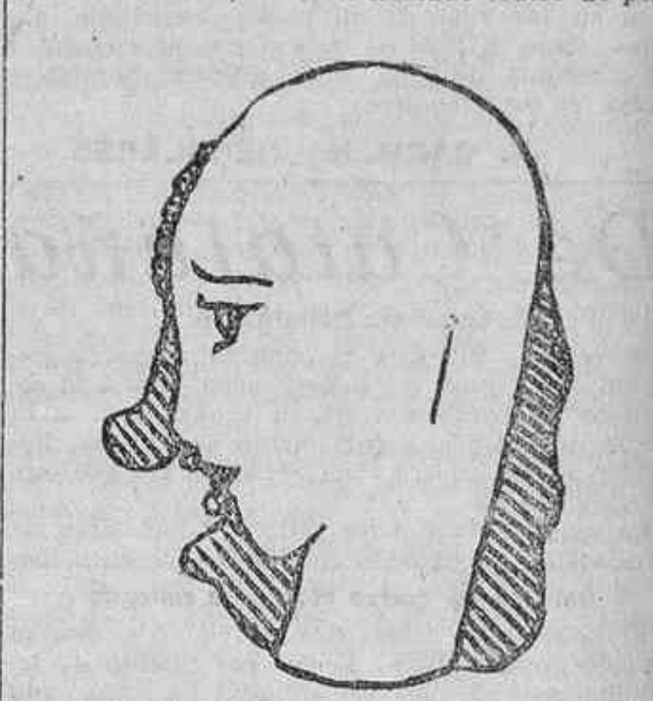
Esquema de la máscara de caucho.

Literariamente, el criterio teatral de Bragaglia está definido de modo breve en estos párrafos que traduzco de alguna de sus crónicas en «Comedia»: «Los partidarios del teatro literario pretenden que los artificios teatrales no son necesarios; que pueden ser arte, pero que no son teatro. Yo digo, por el contrario, que el género que ellos pretenden será literatura, será poesía, será filosofía; pero el teatro es otra cosa; e, indiscutiblemente, no es el llamado teatro de pen-