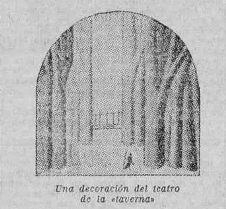
Una decoración del teatro de la taverna.

En Roma, obedeciendo a medidas generales de seguridad, han sido cerrados los Circulos nocturnos de diversiones. No hubo ninguna excepción, y la Prefectura ha sido inflexible. Mas... Este «mas» necesita una pequeña nota: Una calle estrecha, en Roma. Ya es hora de cenar.