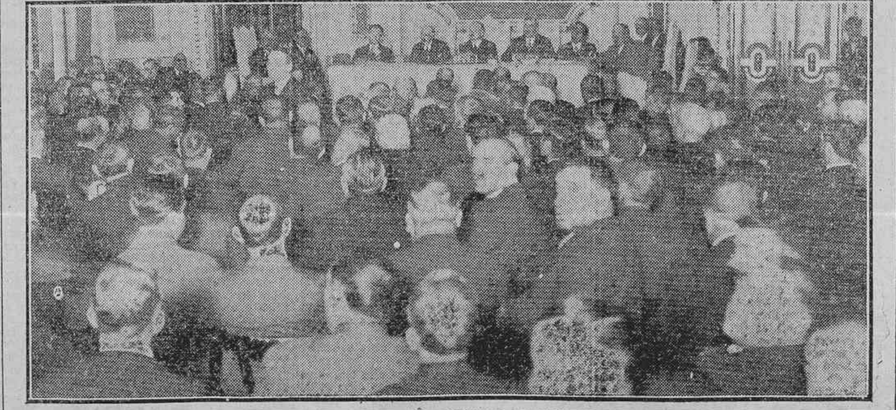
ACTO INAUGURAL DE LA ASAMBLEA DE VINICULTORES Y FABRICANTES DE ALCOHOL VINICO, CELEBRADO AYER EN EL CIRCU.

La «Gaceta» de hoy jueves publica el decreto aprobando el nuevo Estatuto por el que ha de organizarse el régimen de las Clases pasivas.