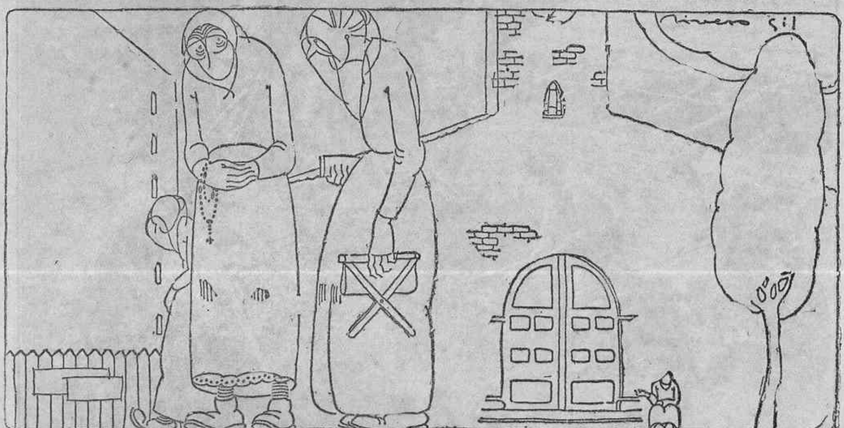
¡Ha visto usted? Siguen llegando los frailes expulsados de Méjico. ¡Pobrecillos! Menos mal que aún les queda este rincón del mundo donde todos son pocos.