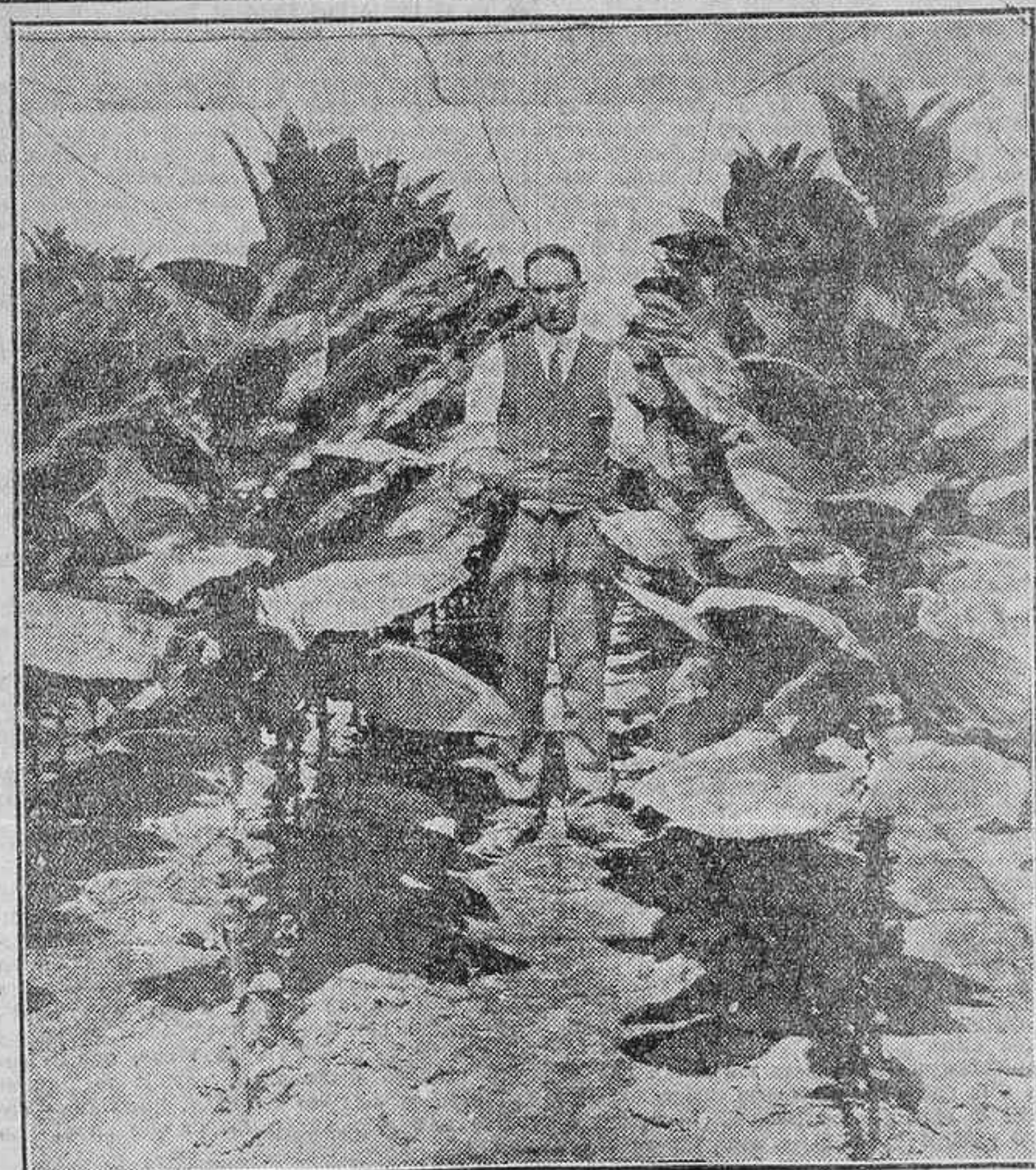
LA DEL HUMO.—ENSAYO DE UNA NUEVA VARIEDAD DE TABACO

Barcelona cotiza: Benloch, 0, de 58,50 a 59,50 pesetas los 100 kilos; florete, de 60,50 a 62,50; selecto, flor, de 62 a 64,50; mazzado corriente, de 60,50 a 61,50; selecto, de 62,50 a 63,50; bom-