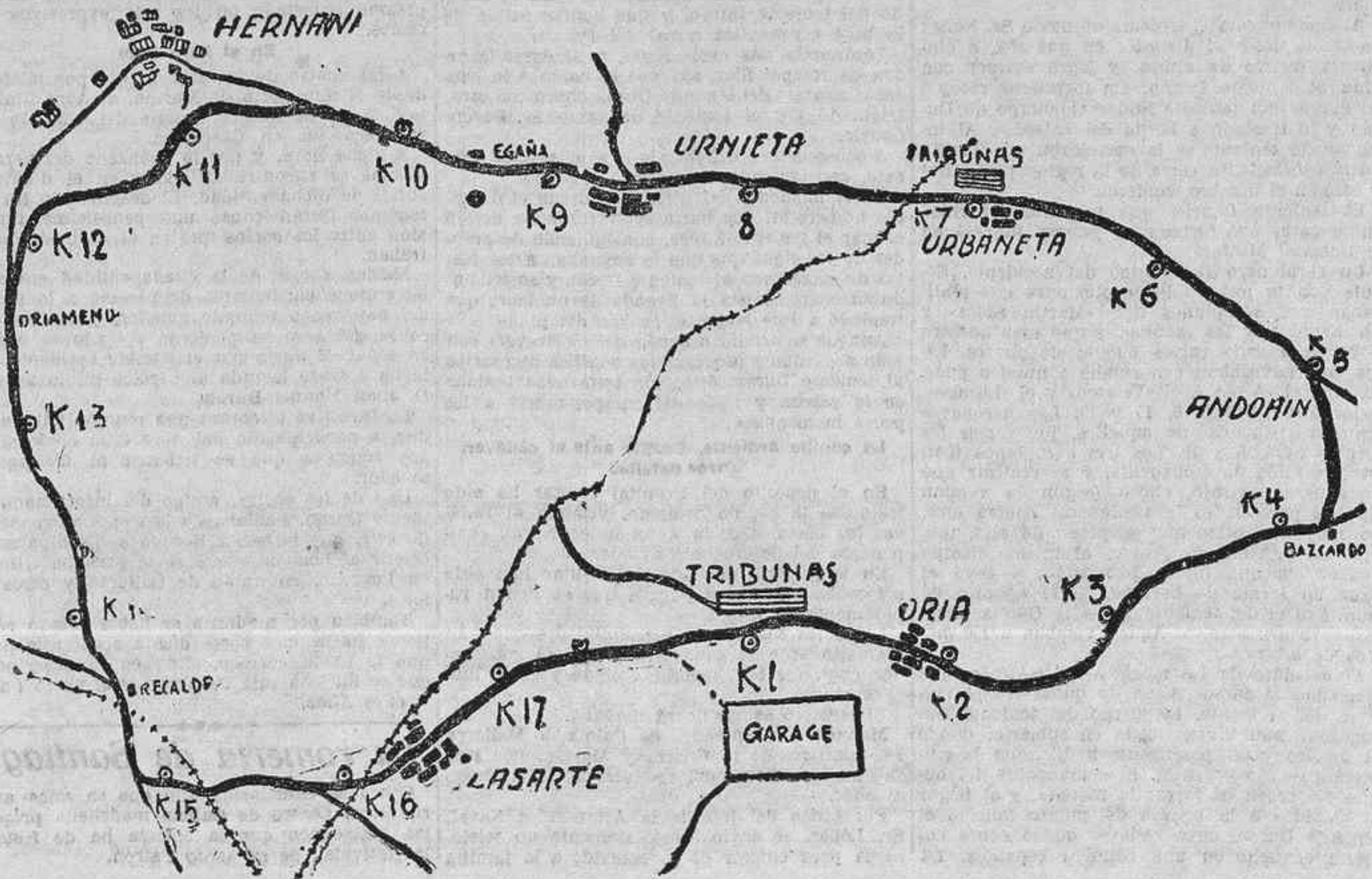
EL CIRCUITO DE LASARTE, DONDE SE HA CORRIDO EL GRAN PREMIO DE EUROPA

Los resultados fueron: Carreras: 400 metros, eliminatorias. Primera: 1, Climent, 55 s. 3/5; 2, Lacarda; 3, Baux. Segunda: 1, Bonilla, 57 s. 3/5; 2, Soler; 3, Gamo. Relevos, 4 por 100, 1, equipo formado por Re