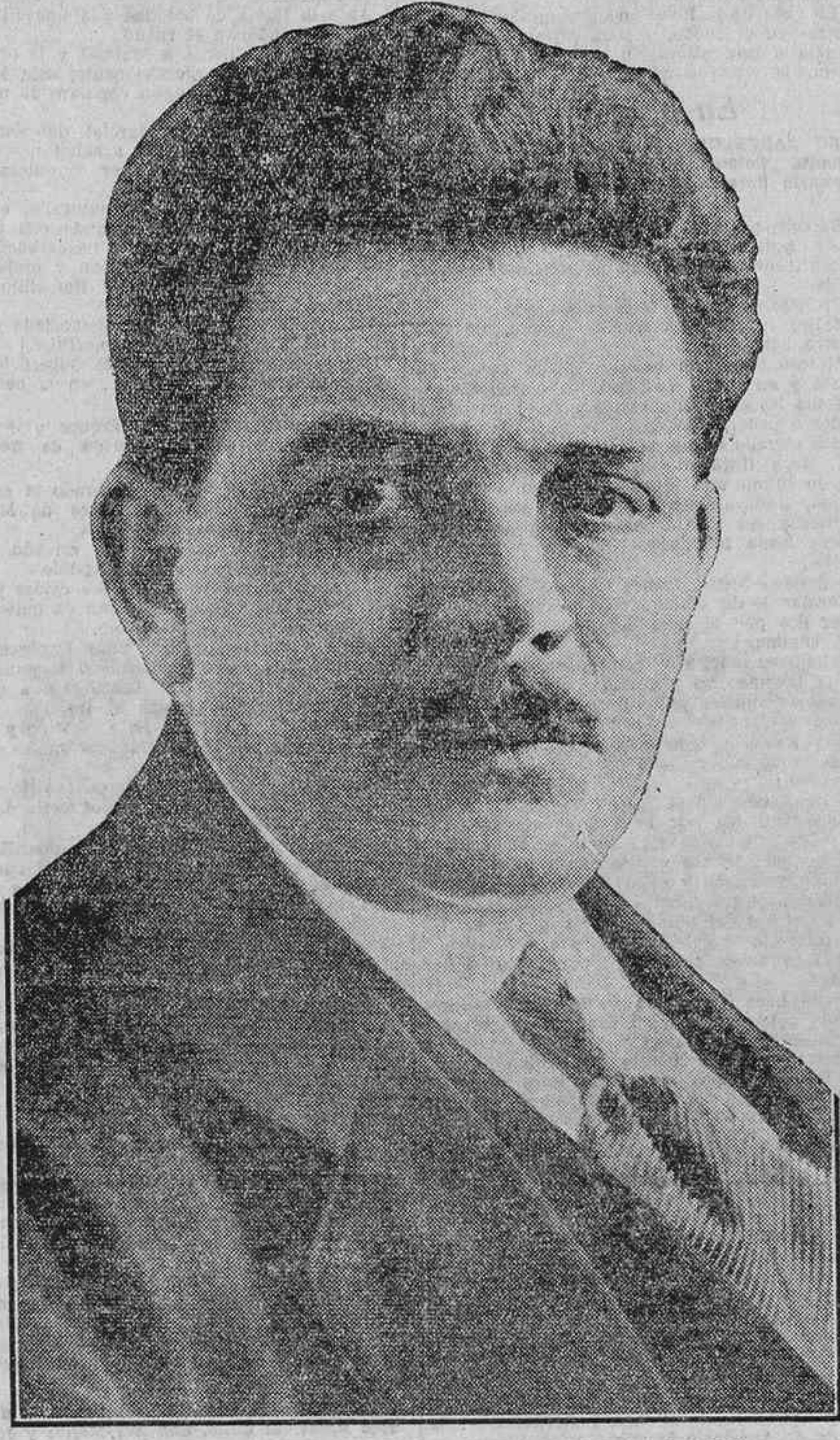
EDUARDO HERRIOT, JEFE DEL NUEVO GOBIERNO FRANCÉS

París, 19.—Los diarios anuncian la dimisión de Renaudel como delegado ejecutivo de la Internacional socialista. Esta dimisión ha sido