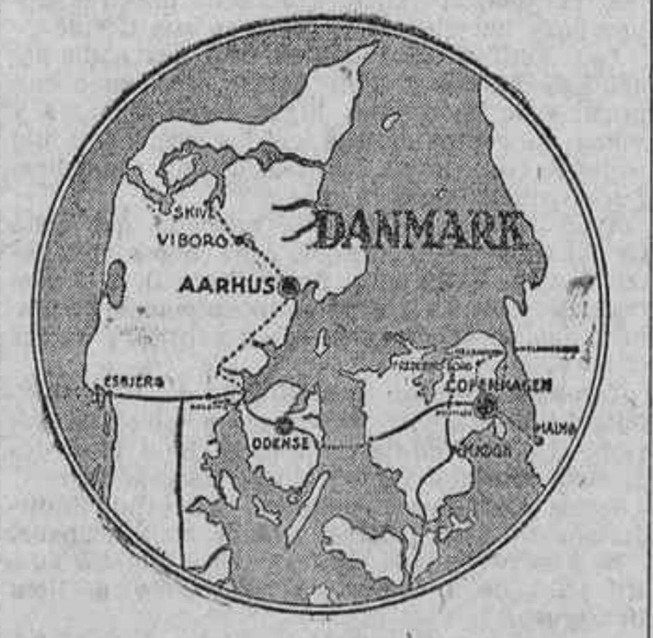
Itinerario y sitio del tercer Congreso Georgista, que se celebrará en Dinamarca del 20 al 31 de Julio próximo

Se celebrará en Dinamarca Dinamarca es un país que llama la atención en el mapa por su situación, el bien es de escasos recursos naturales y de pocas atracciones para el turista que busca pasatiempos y distracciones.