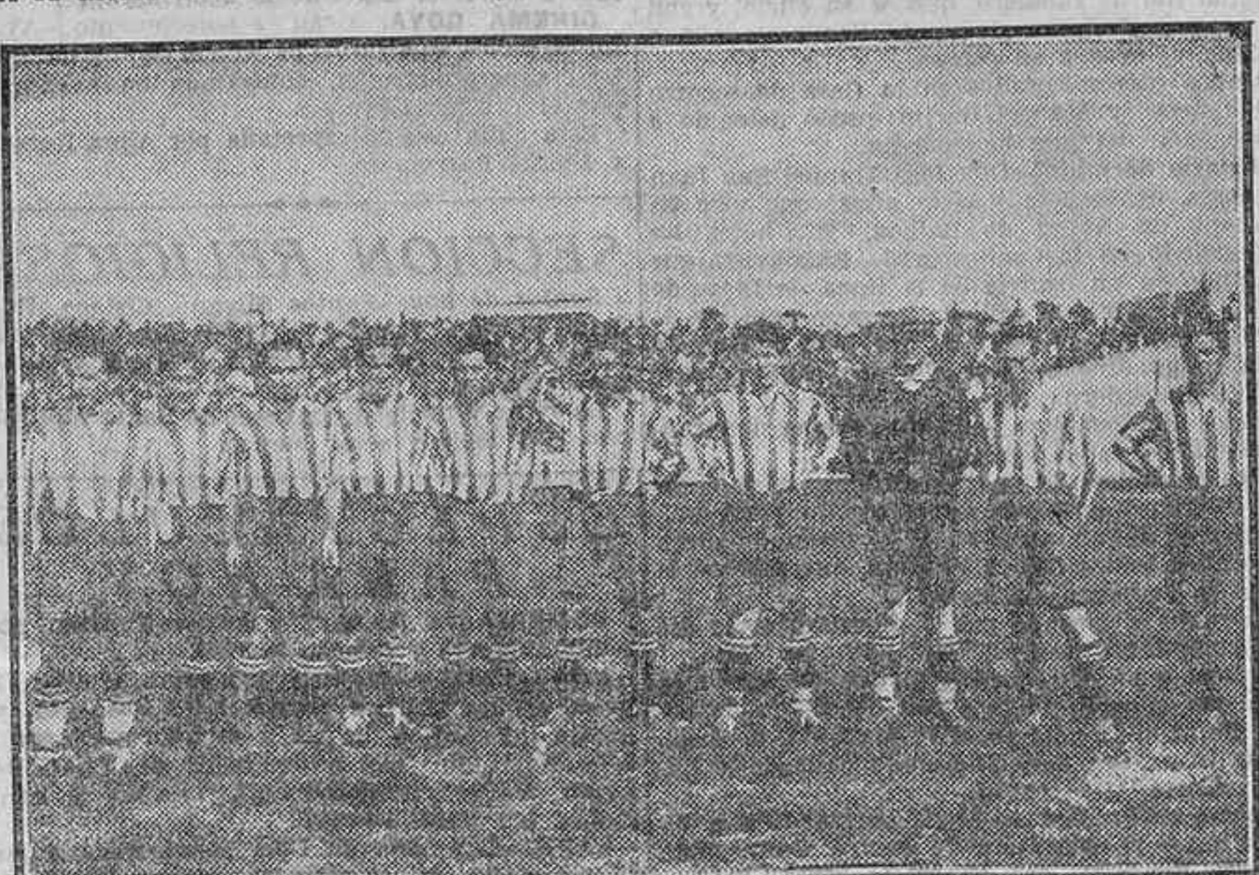
DEL PARTIDO ATHLETIC CLUB-ESPAÑOL.—EL «ONCE» MADRILEÑO, QUE RESULTO VENCEDOR

BILLETES DE FERROCARRILES PASAJES MARITIMOS EXCURSIONES - PEREGRINACIONES INFORMES GRATUITOS