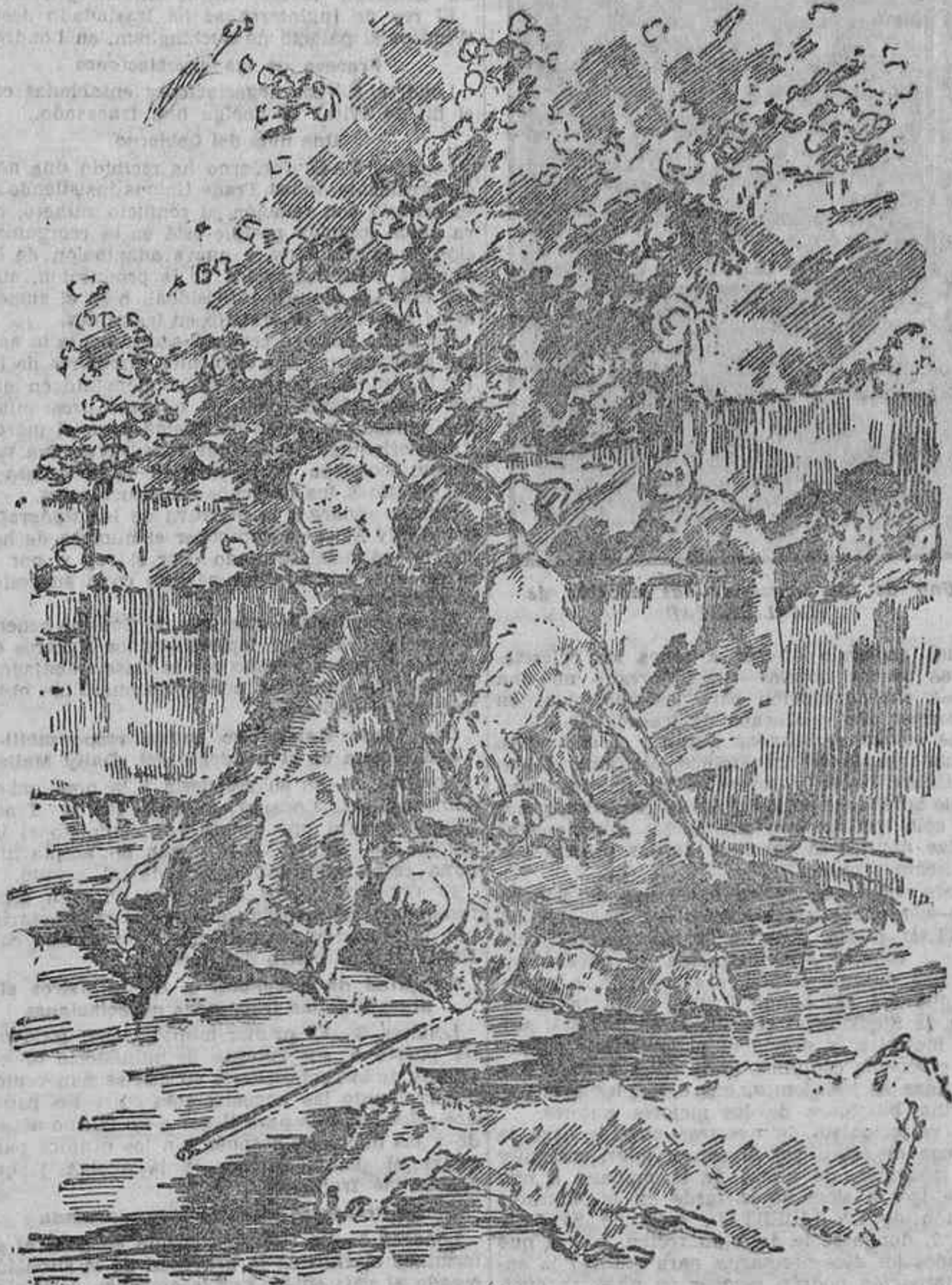
LA CORRIDA DE AYER EN MADRID.—UNA CAIDA DE PELIGRO

y un descabello al segundo intento. (Ovación y petición de oreja.) Quinto.—Mejías veroníquea bien. Vuelve a banderillar, clavando tres pares colosales. (Ovación.) Hace una faena muy valiente y es cogido y coreado en el suelo. Sigue la faena valiente, para dos pinchazos y una estocada superior. (Ovación y oreja.) Sexto.—Pepe Belmonte lancea deslucido.