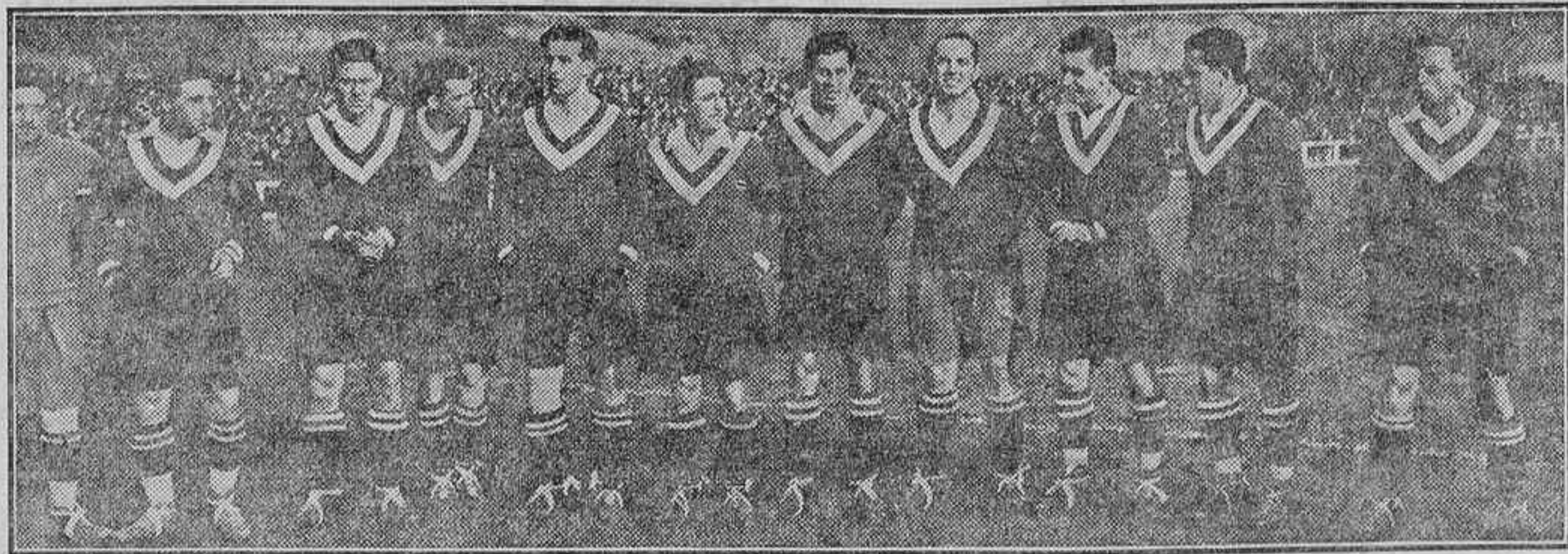
DEL PARTIDO MADRID-ATHLETIC.—EL «ONCE» GANADOR

Barcelona, 18.—Durante todo el día sopló un fuerte viento, que hizo desde luego caer que desluciría todos los partidos.