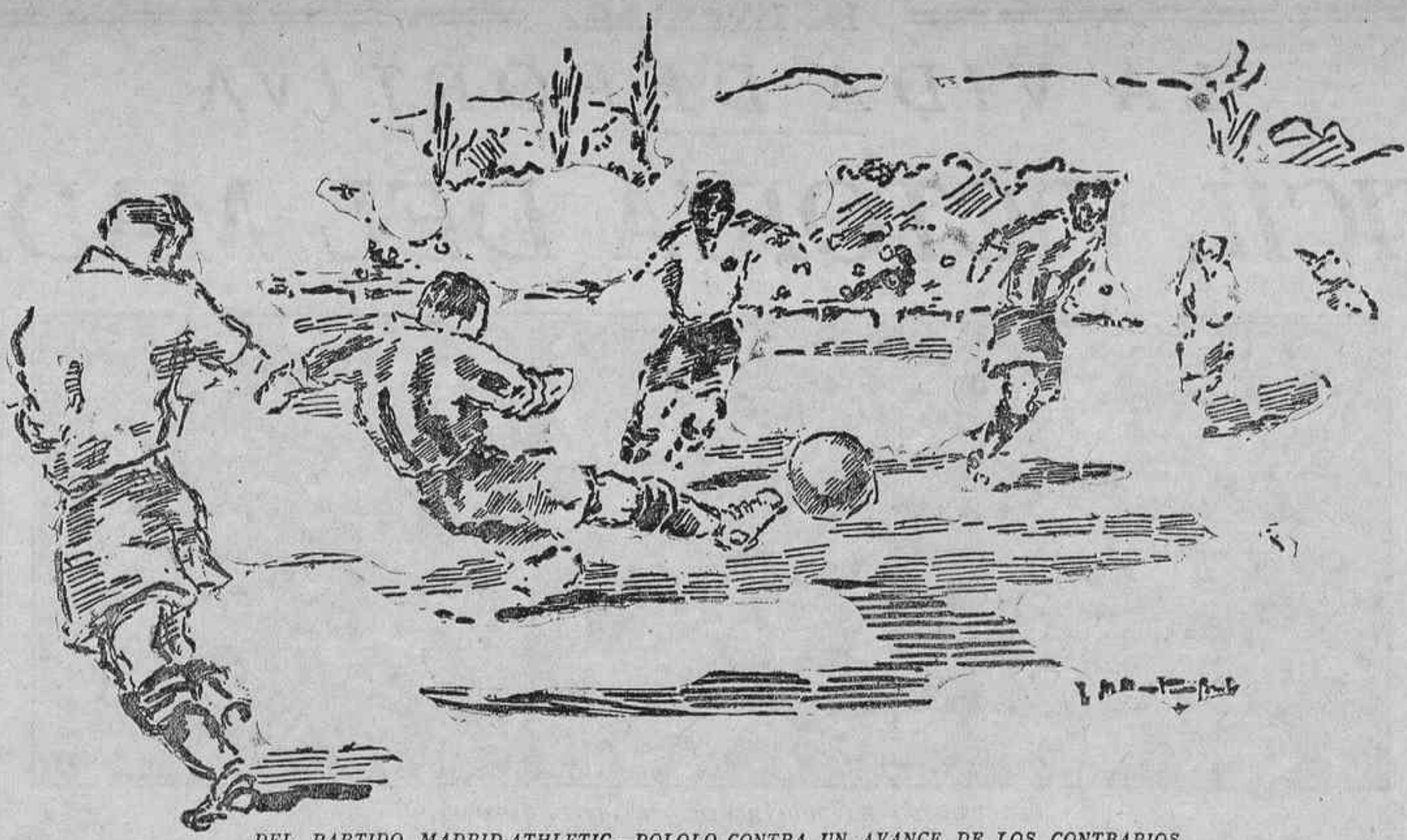
DEL PARTIDO MADRID-ATHLETIC.—POLOLO CONTRA UN AVANCE DE LOS CONTRARIOS

GASOLINA P. P. P. Petróleo Porto-Pi MADRID