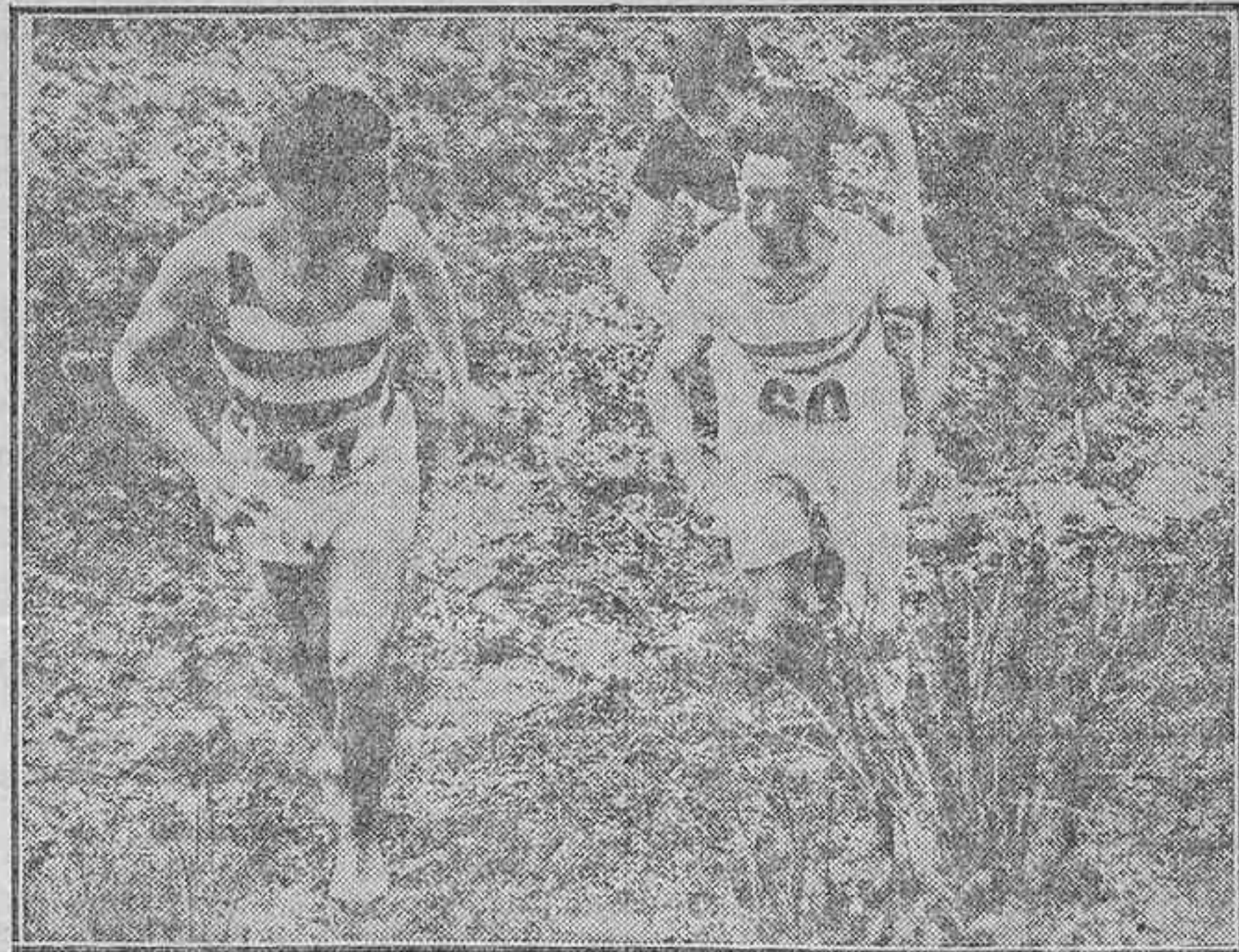
DEL CAMPEONATO DE CASTILLA A TRAVES DEL CAMPO.—UN MOMENTO DE LA PRUEBA CORRIDA ANTEAYER

ACADEMIA AMERICANA DE AUTOMOVILISMO Profesores ambos sexos GENERAL ORAA, 62