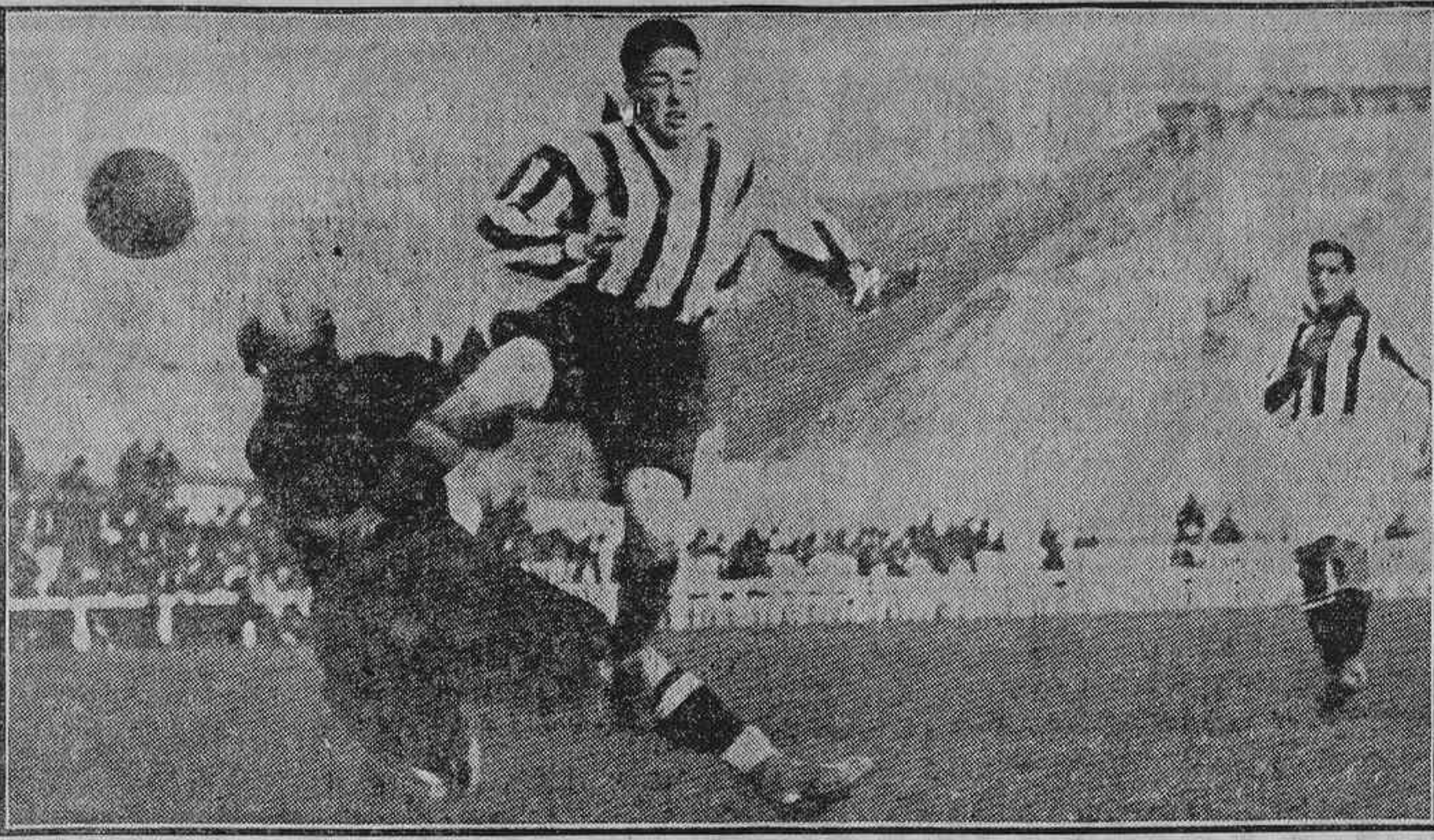
EL PARTIDO DE AYER.—EL DELANTERO CENTRO DEL ATHLETIC DERRIBA AL GUARDAMETA DEL BETIS, DE SEVILLA, Y HACE EL PRIMER «GOAL» DE LA TARDE

El encuentro ha sido interesante. Se ha jugado, especialmente la segunda parte, a un tren rapidísimo, y, en general, con brío y alma por ambas partes, aunque no por todos los elementos del Racing.