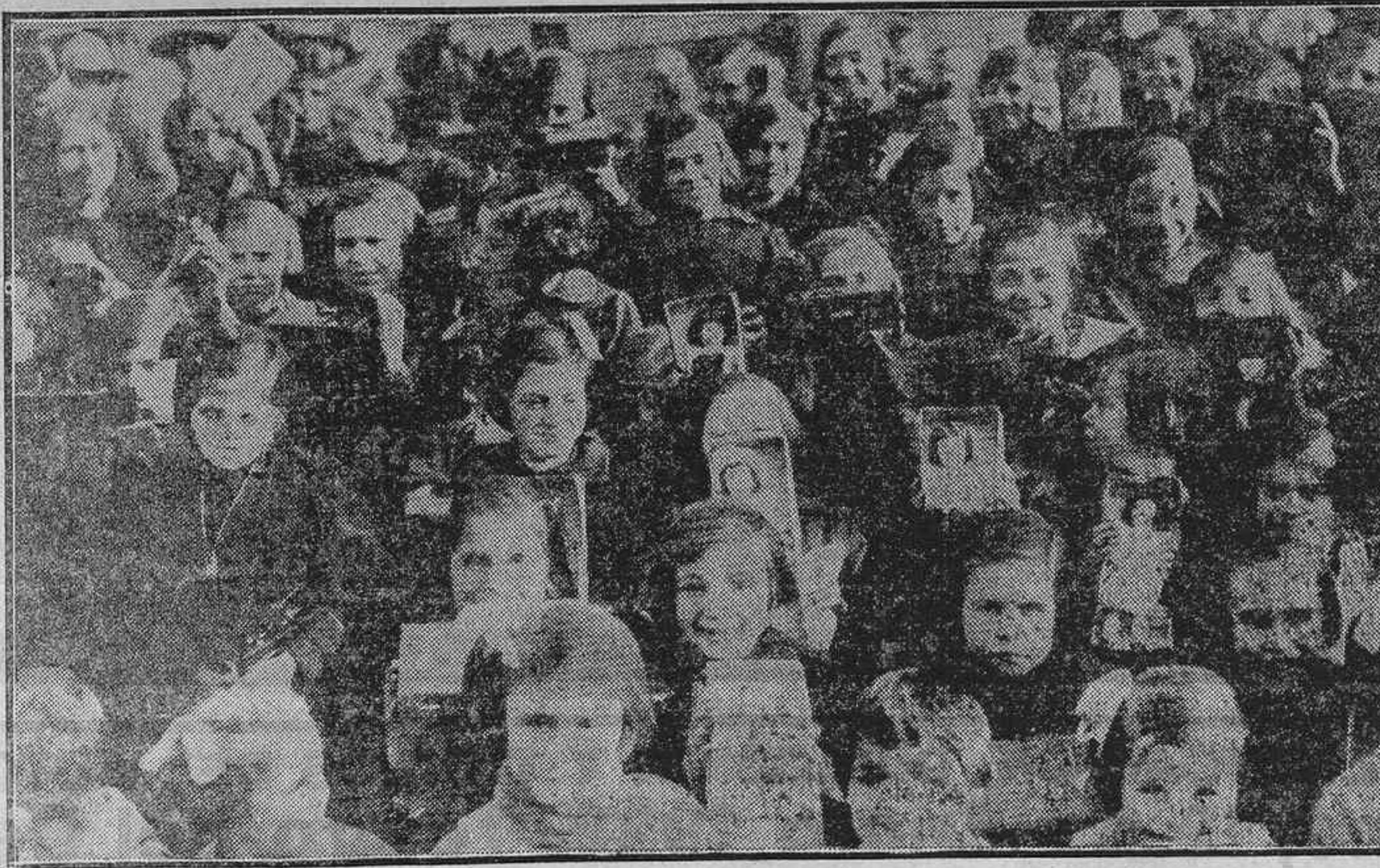
LA FESTIVIDAD DE REYES.—LAS NIÑAS DEL ASILO DE VALLEHERMOSO, A LAS QUE SE REGALARON AYER JUGUETES

Al fin, participarán los Estados Unidos Washington, 6.—La Comisión de Negocios Extranjeros de la Cámara de Representantes ha aprobado por unanimidad una resolución a favor de la apertura de un crédito de 50.000 dólares, destinado a sufragar los gastos que ocasiona la participación de los Estados Unidos en la Conferencia preparatoria de Ginebra sobre el desarme.