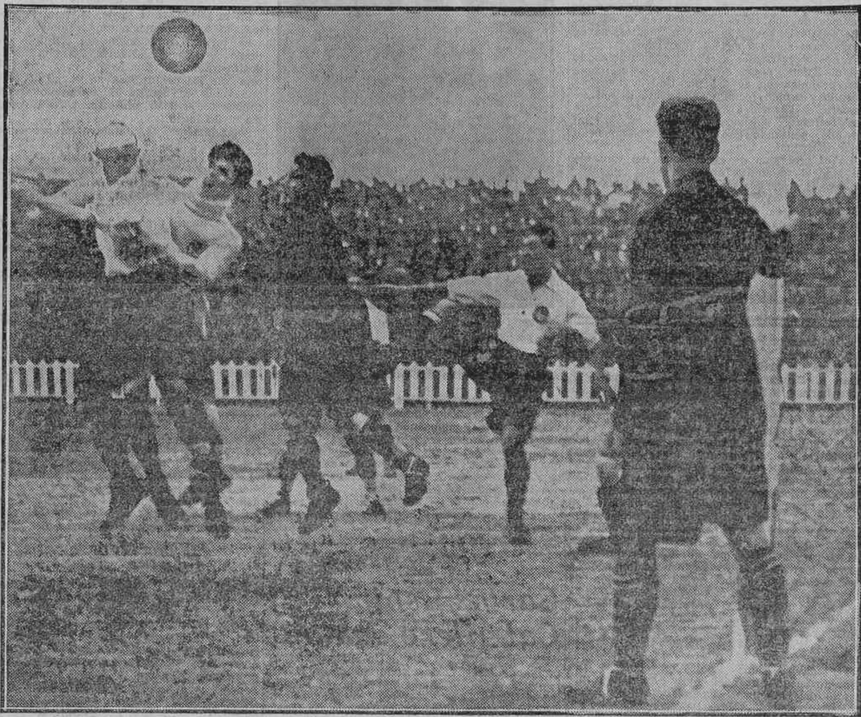
UN MOMENTO DEL PARTIDO JUGADO EL DOMINGO ENTRE EL MADRID Y EL UNION SPORTING

Galicia: En Vigo, el Unión Sporting ganó (5-4)