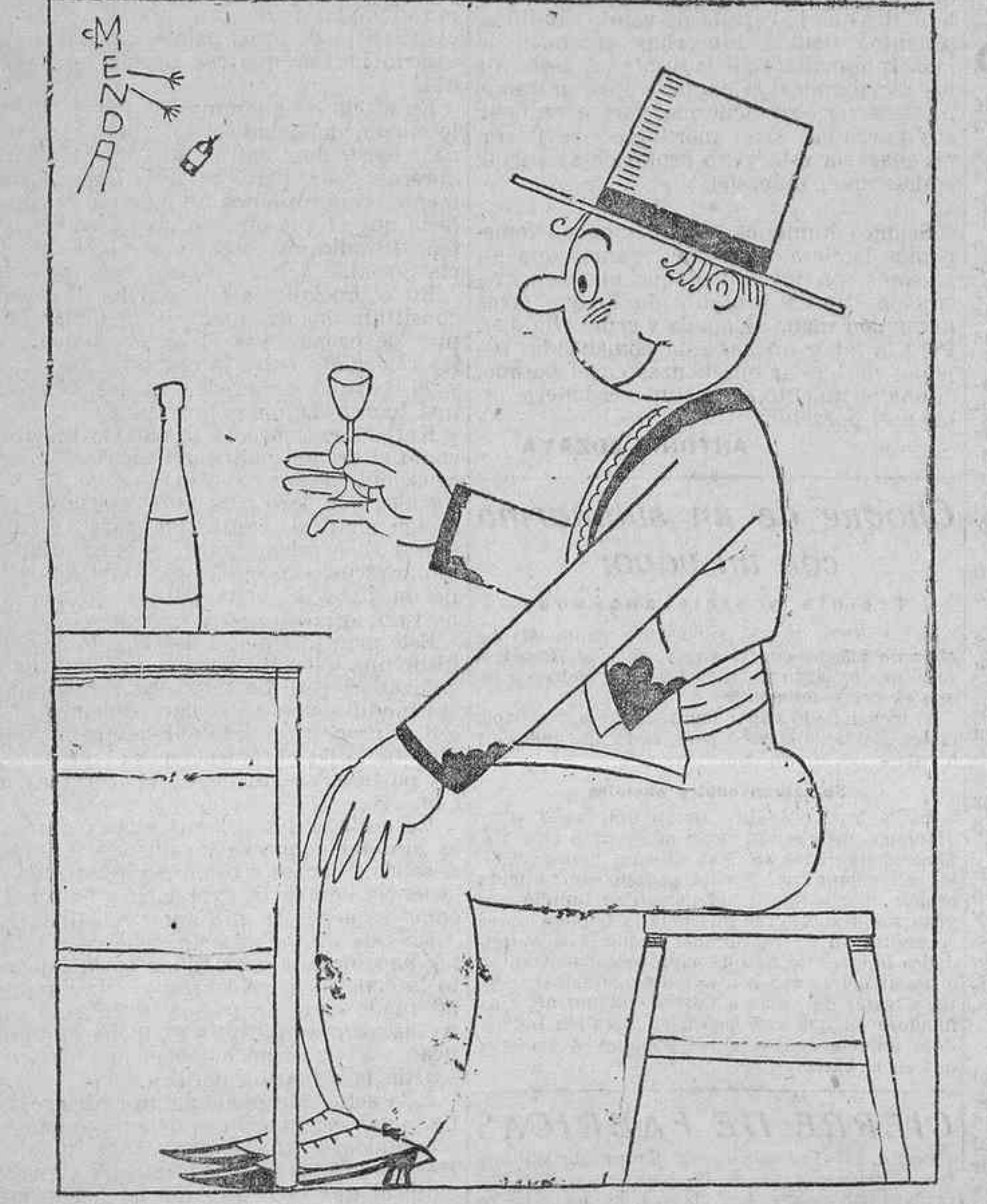
—¿Tiene razón Voronoff! El alcohol no influye en la longevidad. Hay quien se emborracha todos los días y dura mucho tiempo.

Tendremos al corriente a nuestros lectores de cuanto logremos averiguar de esto, al parecer, importante asunto.