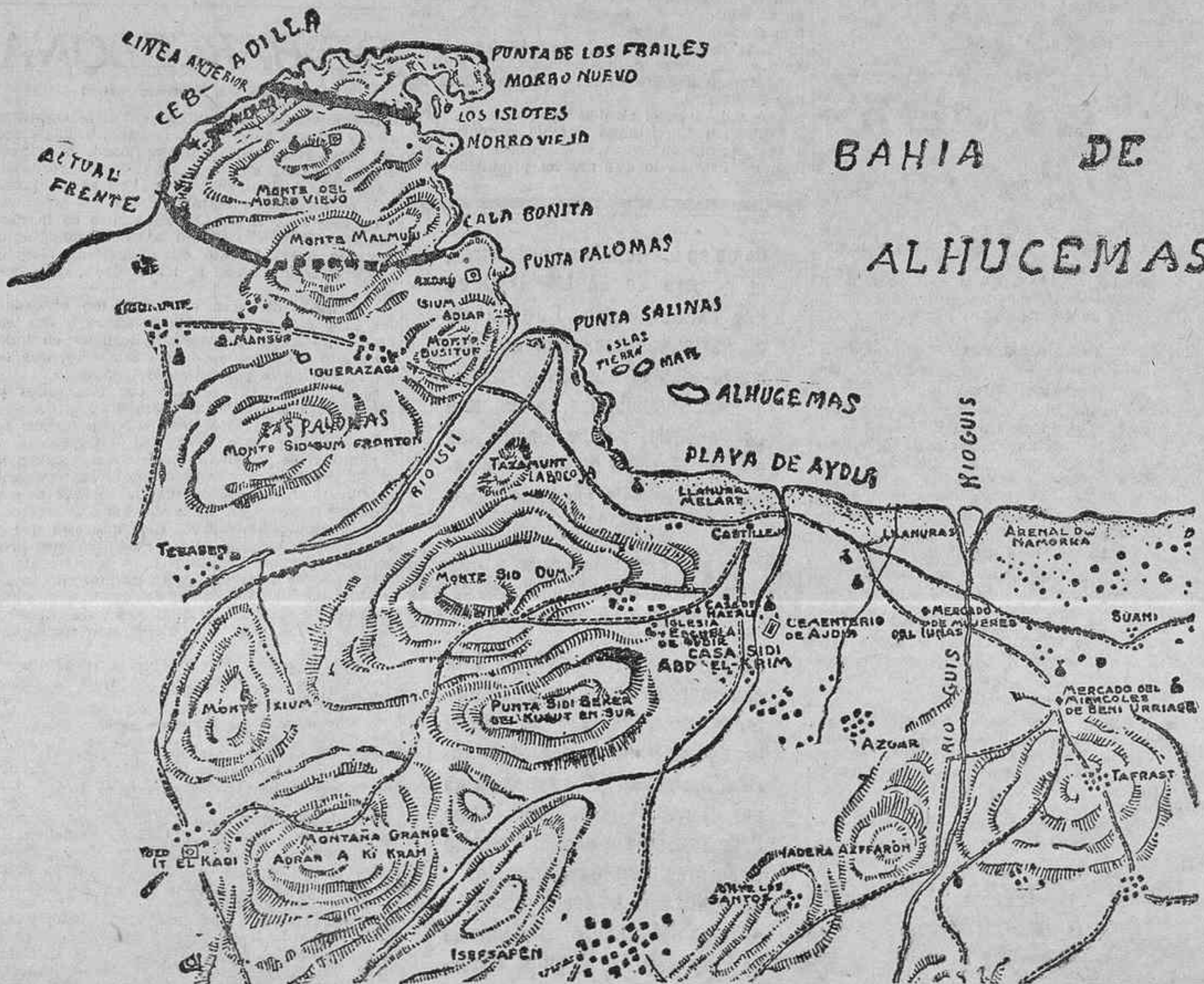
EL DESEMBARCO EN MORRO VIEJO. ANTERIOR Y ACTUAL SITUACION DE NUESTRA LINEA AVANZADA, DESPUES DEL COMBATE DEL 23

Abd-el-Krim, la víspera de la operación, estuvo en su línea avanzada. Permaneció allí hasta las cuatro de la madrugada y momentos antes de dar comienzo el avance se retiró.