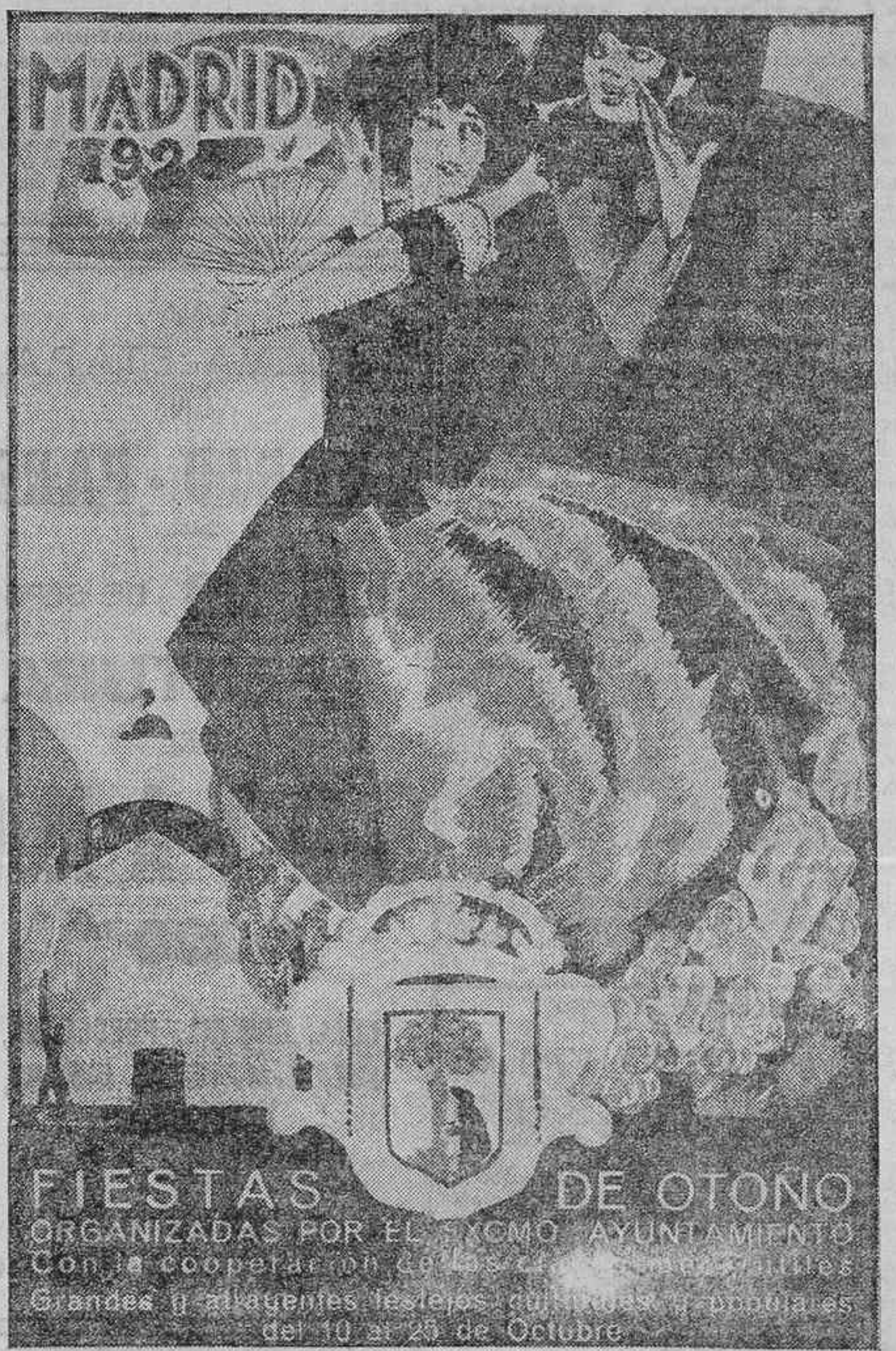
CARTEL ANUNCIADOR DE LAS FIESTAS DE OTOÑO QUE HAN DE CELEBRARSE EN MADRID DURANTE EL MES DE OCTUBRE

La Prensa lamenta que no exista ningún organismo para entablar negociaciones en las disputas industriales.