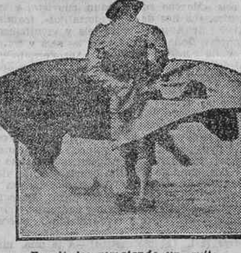
Facultades rematando un quite