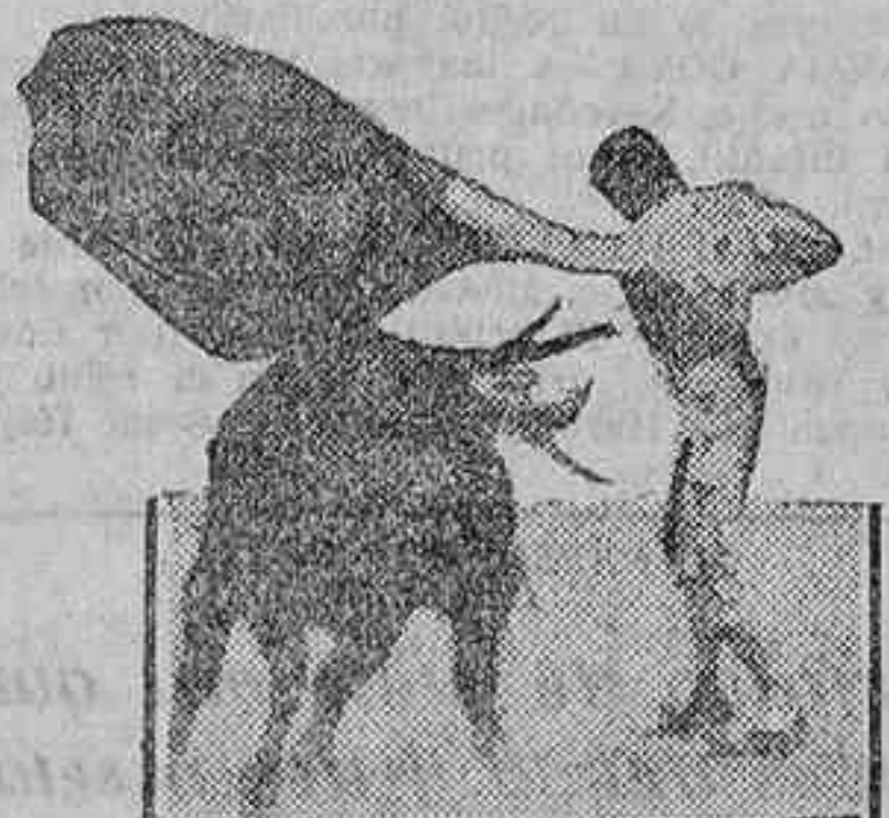
Valencia I pasando de muleta

La ovación fué enorme, merecidísima; se le