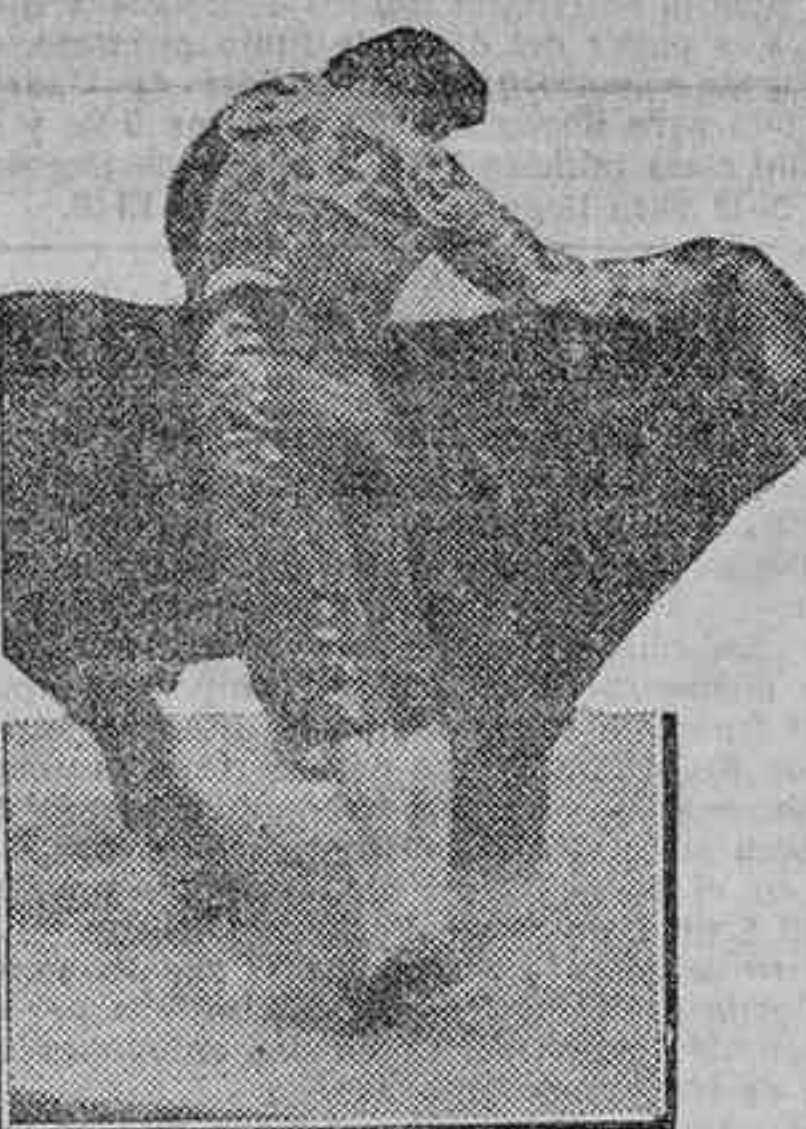
Valencia II toreando por verónicas