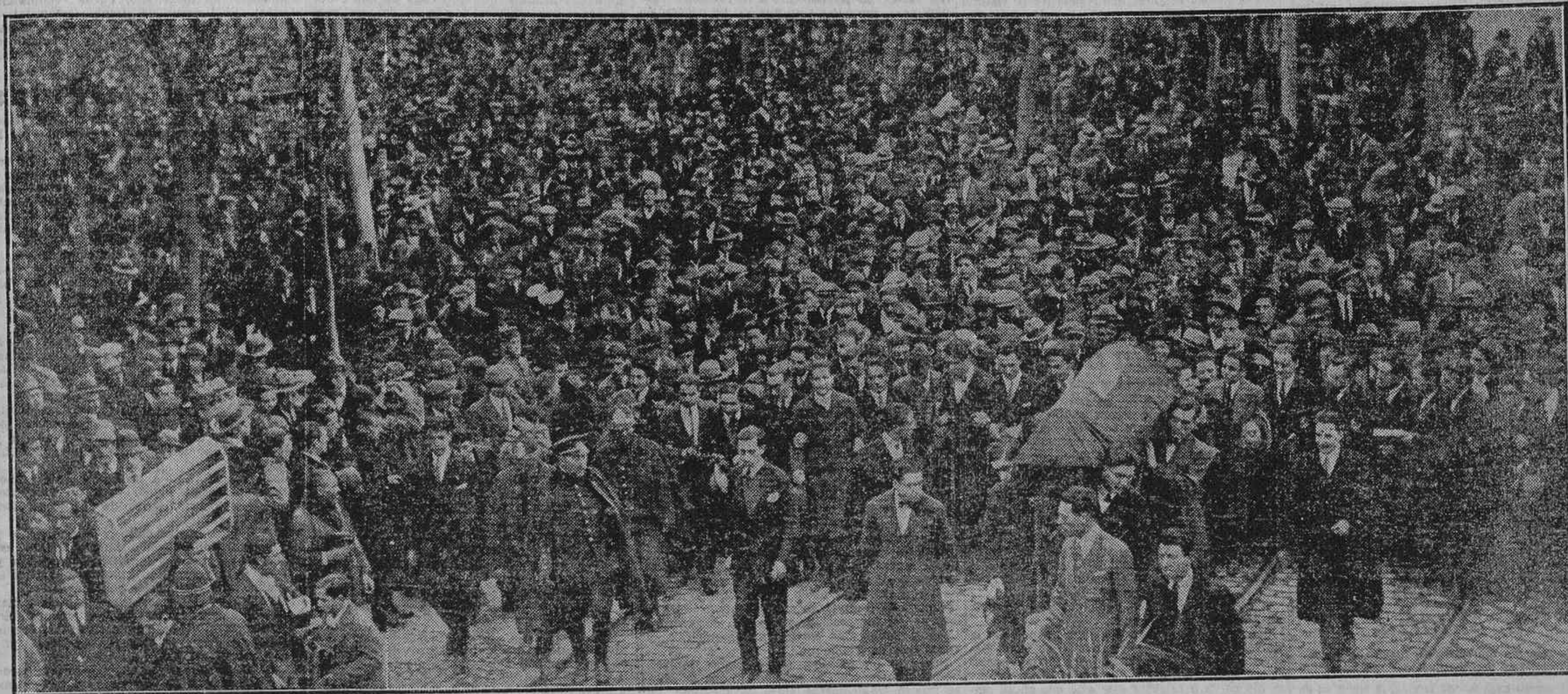
ERAN LA UNIVERSIDAD, EL ATENEO, LAS FIGURAS MAS SALIENTES DE LA INTELLECTUALIDAD LIBERAL, QUIENES ACUDIERON AYER A LA ESTACION DEL NORTE A RECIBIR LOS GLORIOSOS RESTOS DEL GRAN PENSADOR