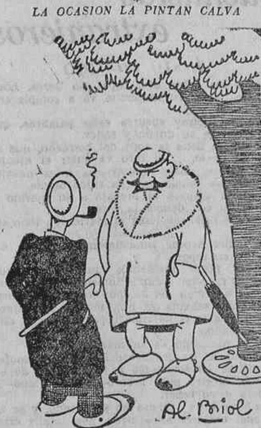
—Cuando me casé, me hubiera comido a mi mujer. ¿Cómo la querías?