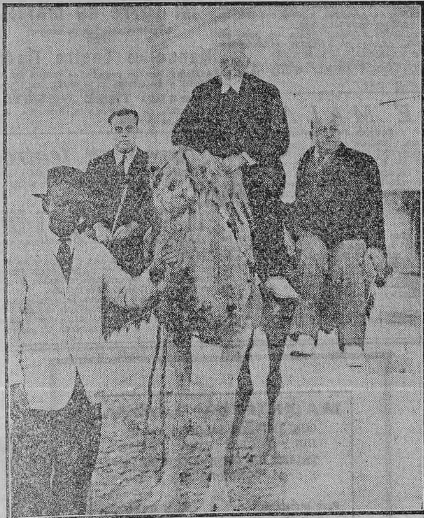
UNAMUNO ELEVADO SOBRE UN CAMELLO QUE ES UN SÍMBOLO, Y ALZÁNDOSE CON ÉL, SIEMPRE SOBRE EL SÍMBOLO CAMELLO, A SU COMPARERO SORIANO Y AL AMIGO DE AMBOS, SEÑOR CASTANYEIRA

tal sin gobernador civil, sin obispado, sin reuniones cursis; una capital más soportable que las demás capitales españolas.