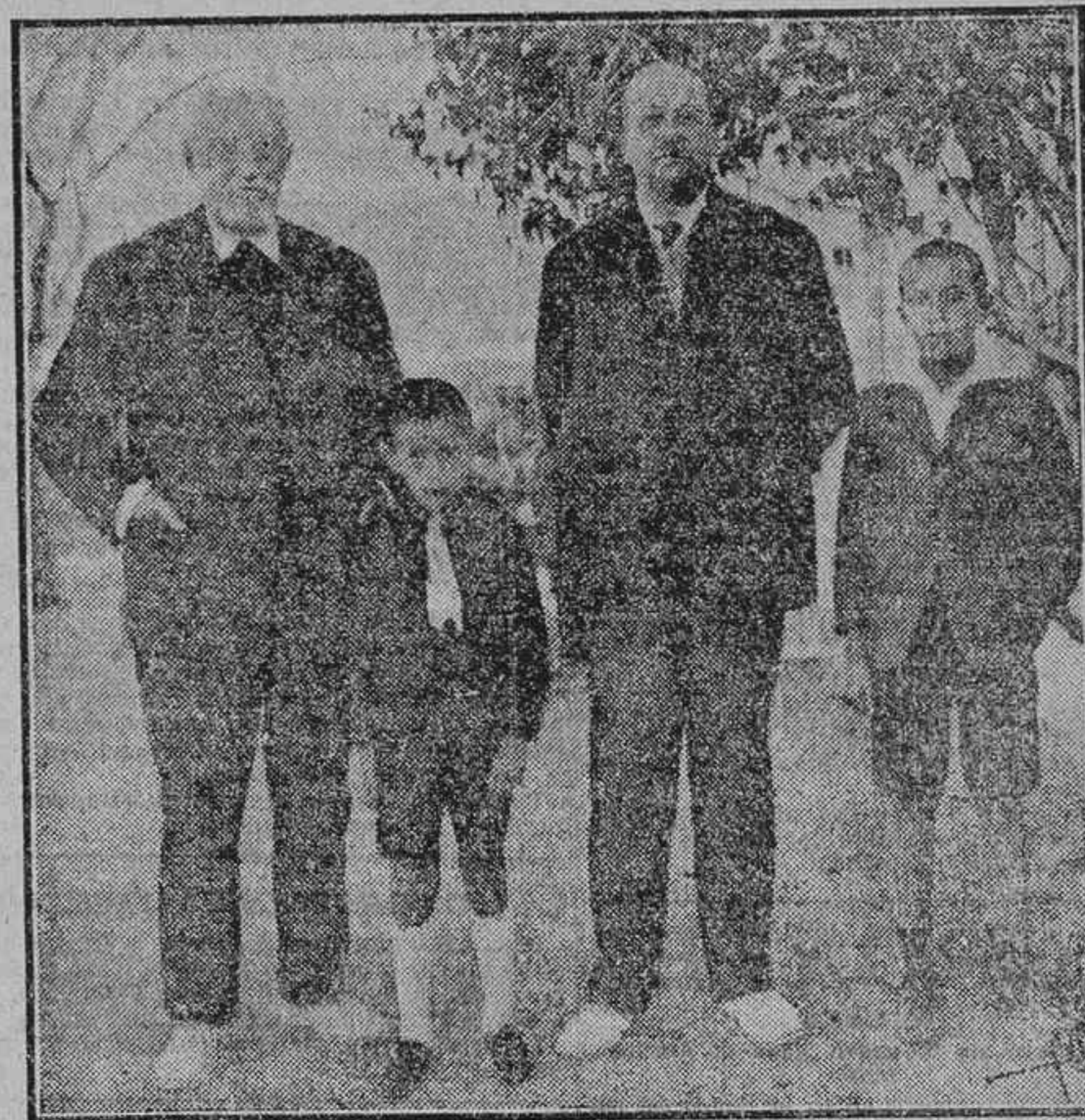
SORIANO Y UNAMUNO CON DOS AMIGUITOS, HIJOS DE PERSONALIDADES DE LA ISLA, QUE, APROVECHANDO LA FELIZ COINCIDENCIA, TOMAN ENSEÑANZAS DE TAN ALTOS MAESTROS