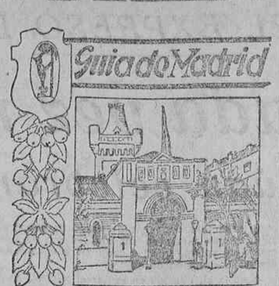
Calle de la Princesa