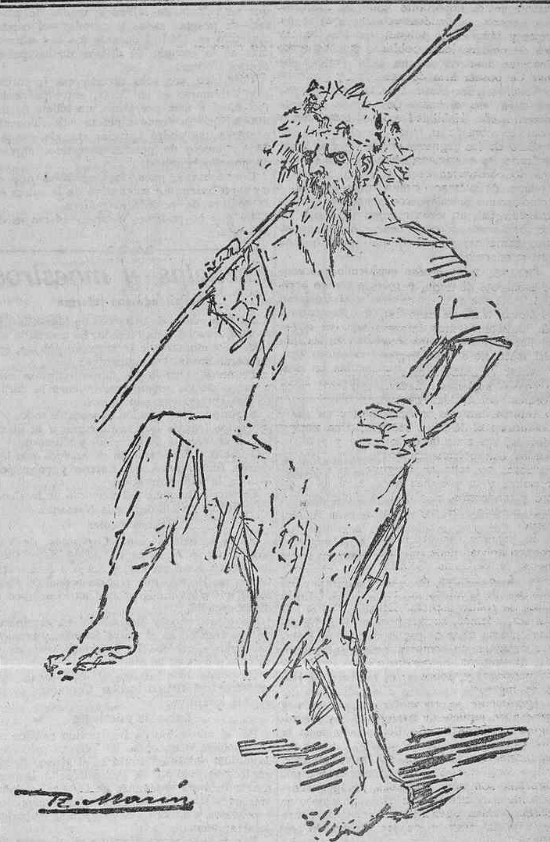
ZACCONI EN «RE LEAR»

«Este pleito tiene que ser eminentemente simpático para autores, actores y empresarios, pues ahora más que nunca se ha demostrado la perfecta solidaridad y unión que existe entre todos.»