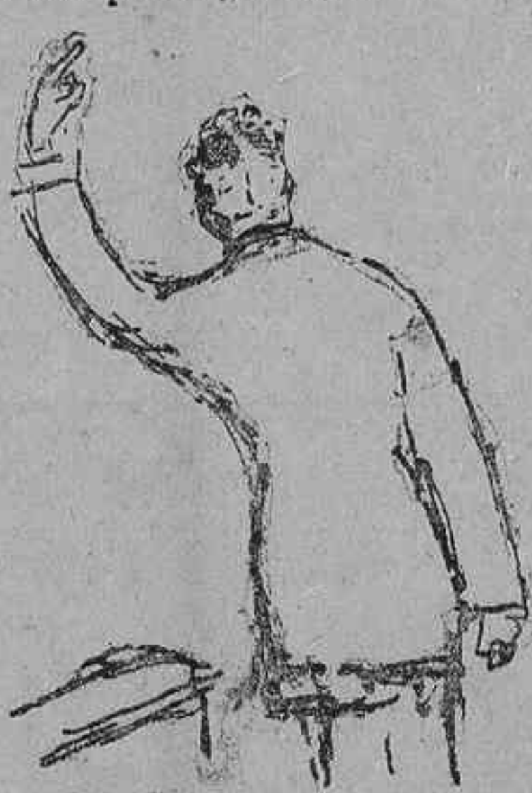
Alcalá Zamora en su interpelación

Comienza por advertir que sus palabras, por vibrantes que parezcan, han de ser ajenas a toda pasión política, aun cuando por