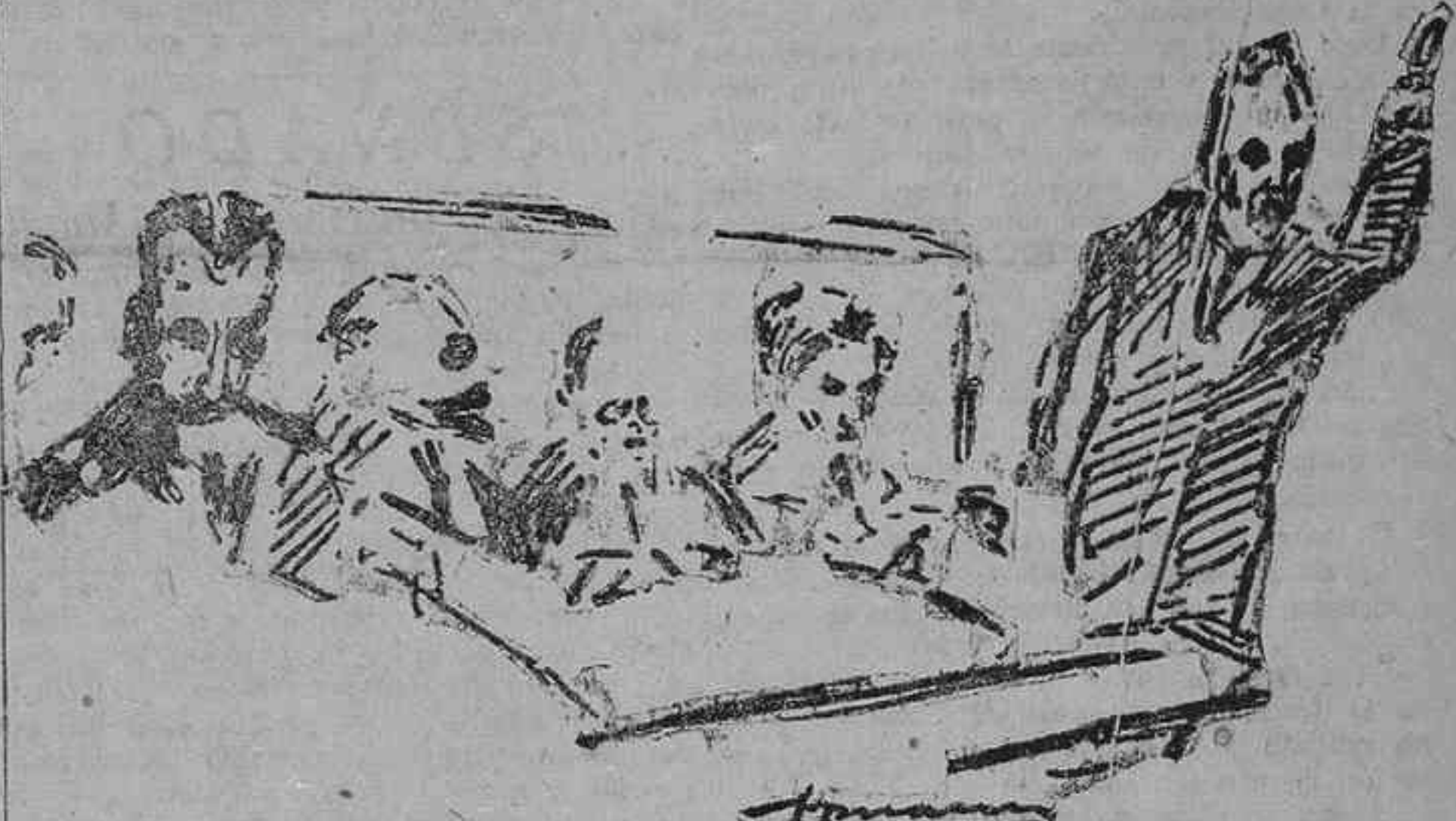
SANCHEZ GUERRA CONTESTANDO A ALCALA ZAMORA

Termina diciendo que este Gobierno, como todos, asume la responsabilidad de los hechos.