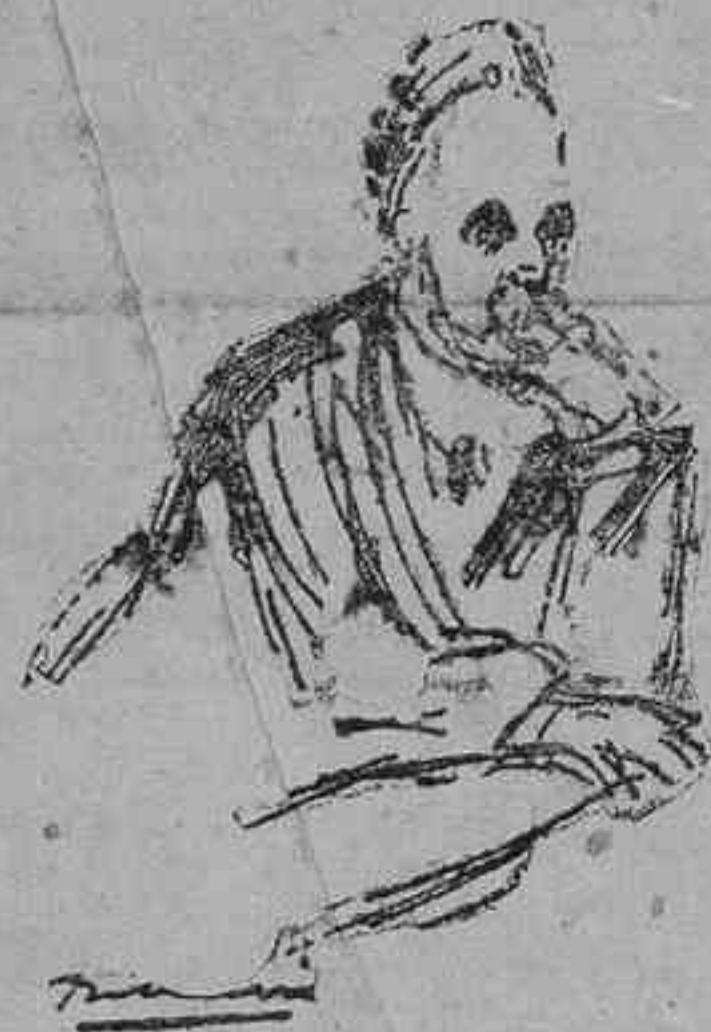
Sánchez Guerra en el banco azul

El Sr. SANCHEZ GUERRA comienza su discurso saludando a la Cámara y dice que viene a cumplir el deber de presentarse ante los diputados en el primer día en que le ha sido posible, una vez integrado el Gobierno.