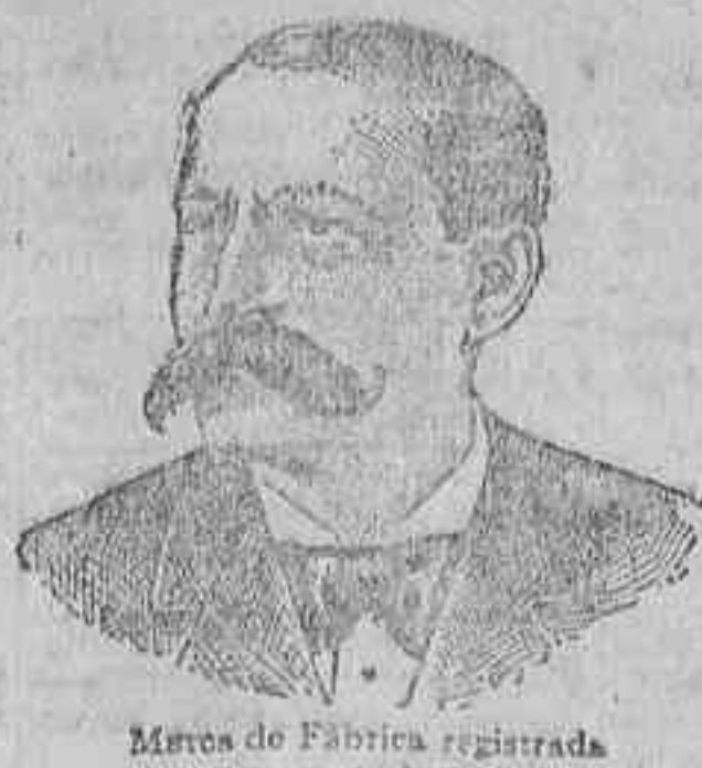
Marca de Fábrica registrada

LA PLATERIA Felipe III, 1 y 3, es la que paga más por alhajas, oro, plata, platino y papeletas del Monte. Especialidad en reformas y composuras.