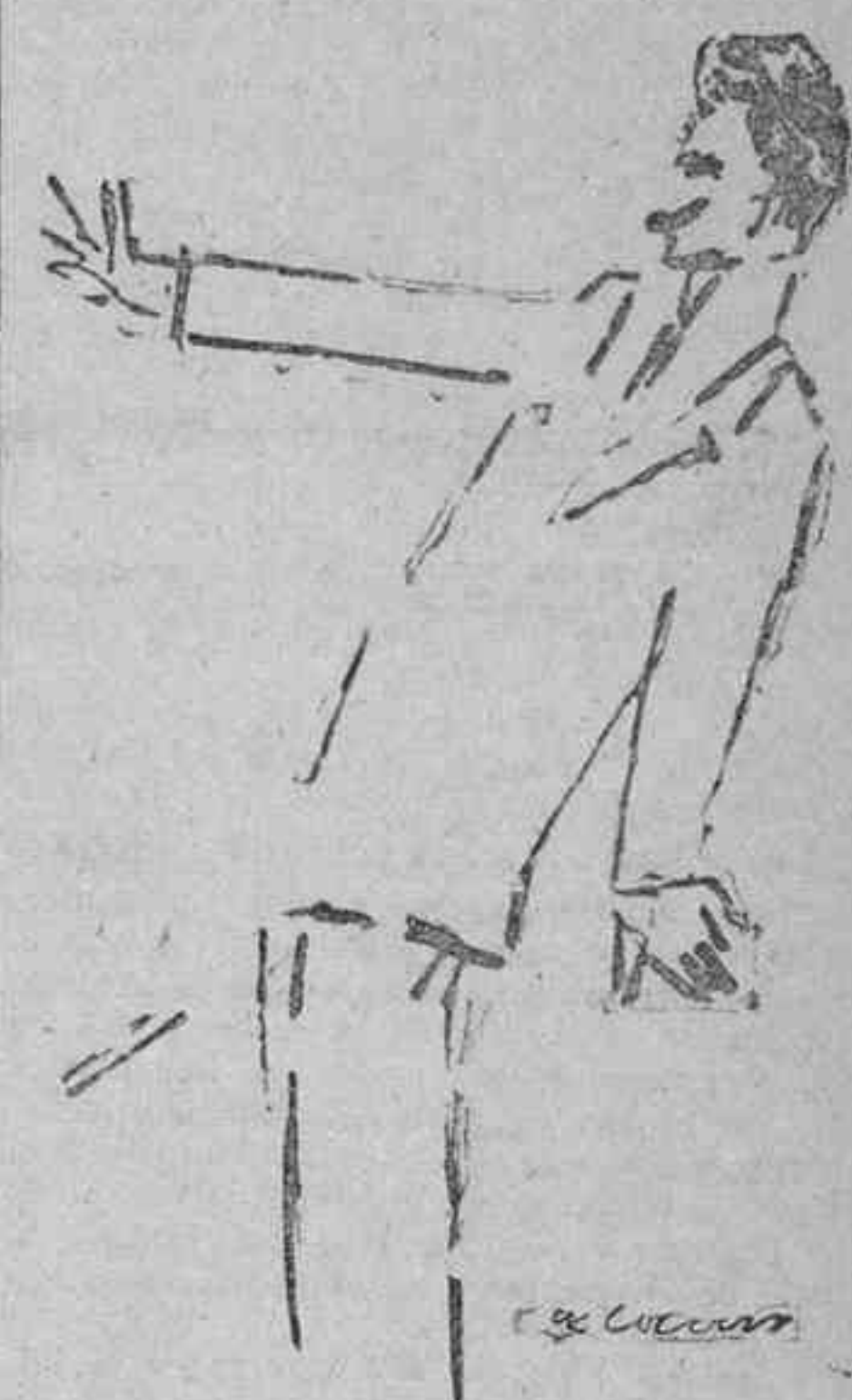
Guerra del Rio impugnando la reforma del Código penal

Añade que no habrá ningún delito relacionado con huelga o coligación en el que no concorra la agravación que supone la circunstancia 25, y a que ésta dice textualmente: «Cometer el delito con un objeto político o social en odio o venganza contra las autoridades, clases del Estado o particulares,