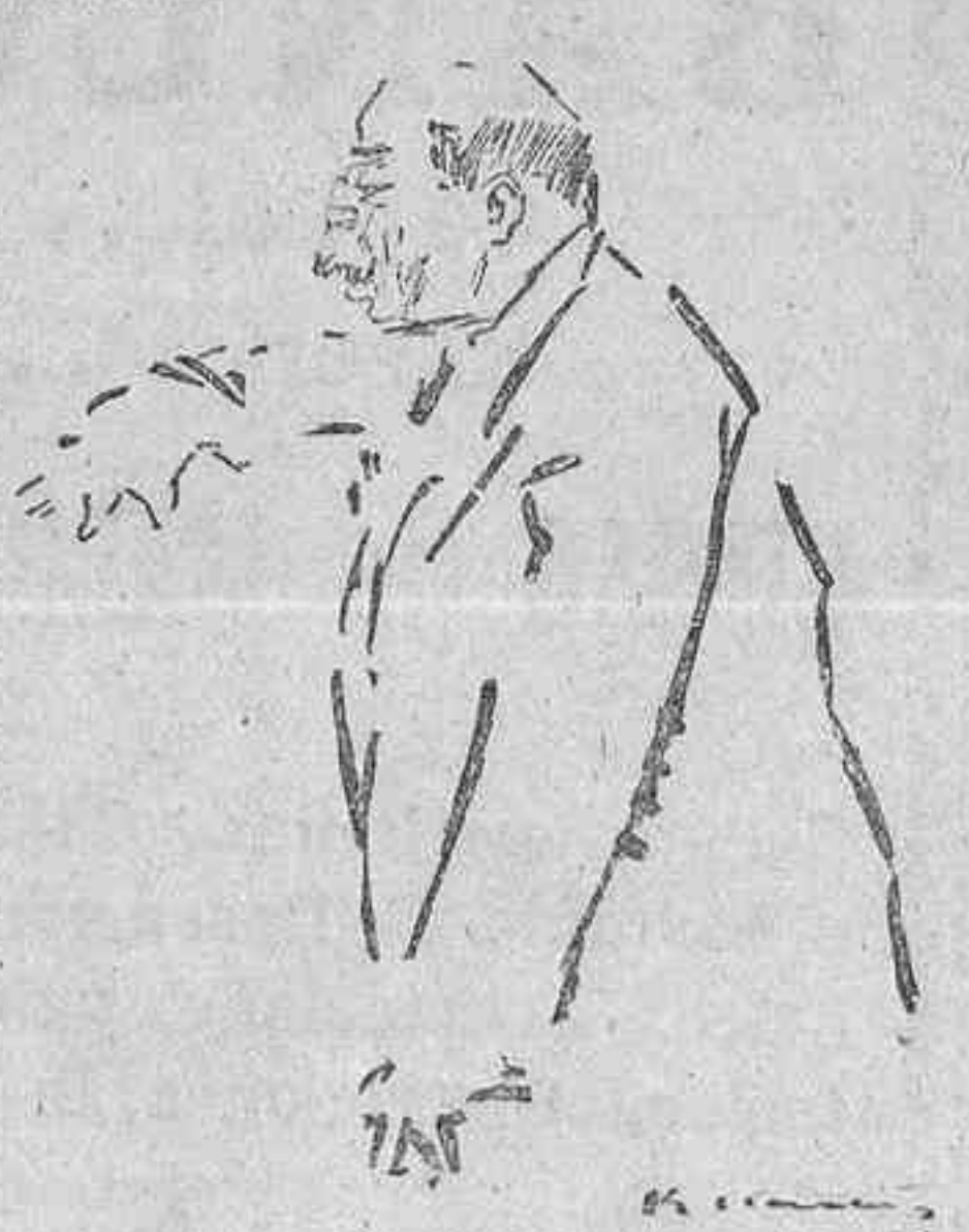
Nougés tratando de los sucesos del cuartel del Carmen, de Zaragoza

Lo que hay que hacer es dar a las directivas obreras la garantía de que no serán perseguidas. Entonces irá a ellas la verdadera representación de las clases obreras y se habrá dado un gran paso para regenerar esas Sociedades.