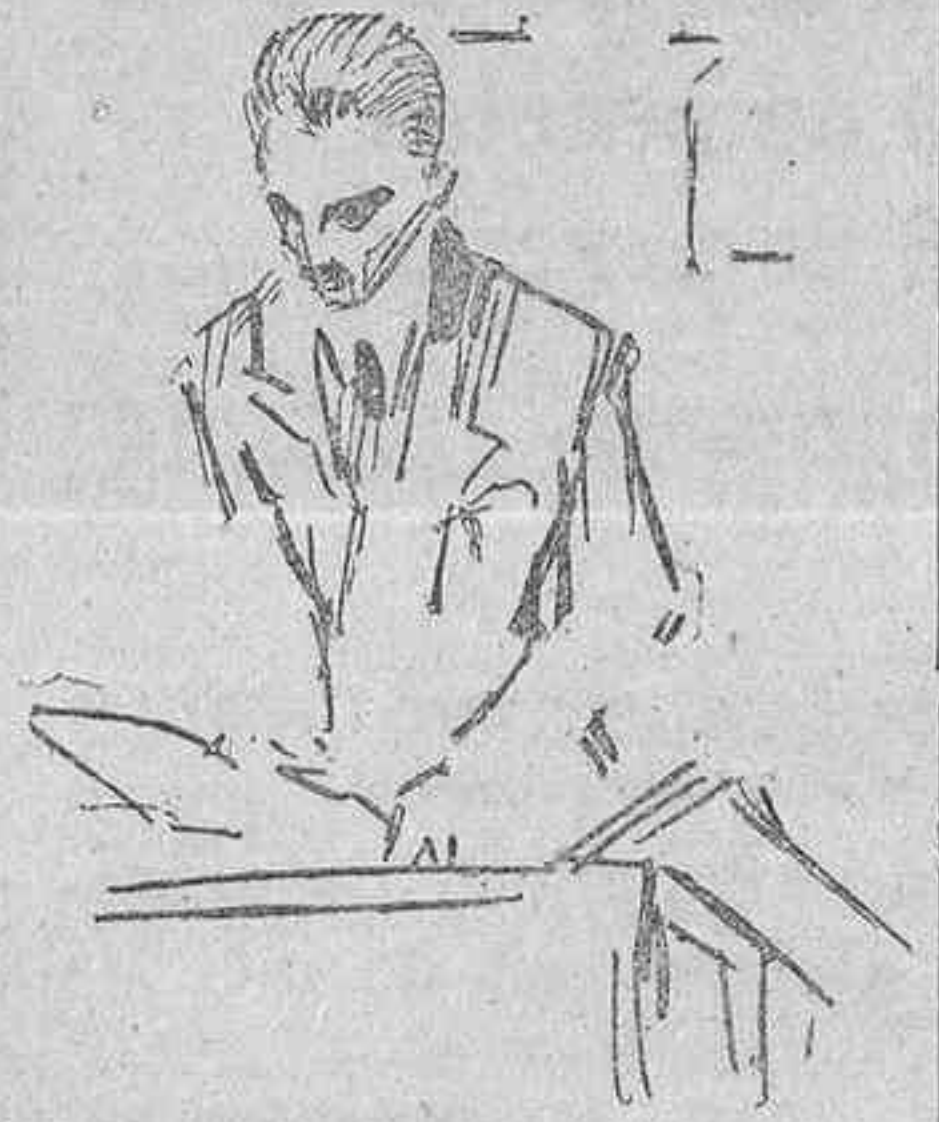
El marqués de Buriel leyendo dictámenes de la Comisión en la tribuna de secretarios

El Gobierno debe disponer de las tarifas. Por no disponer de ellas ahora no ha podido ir más lejos en la cuestión del pan.