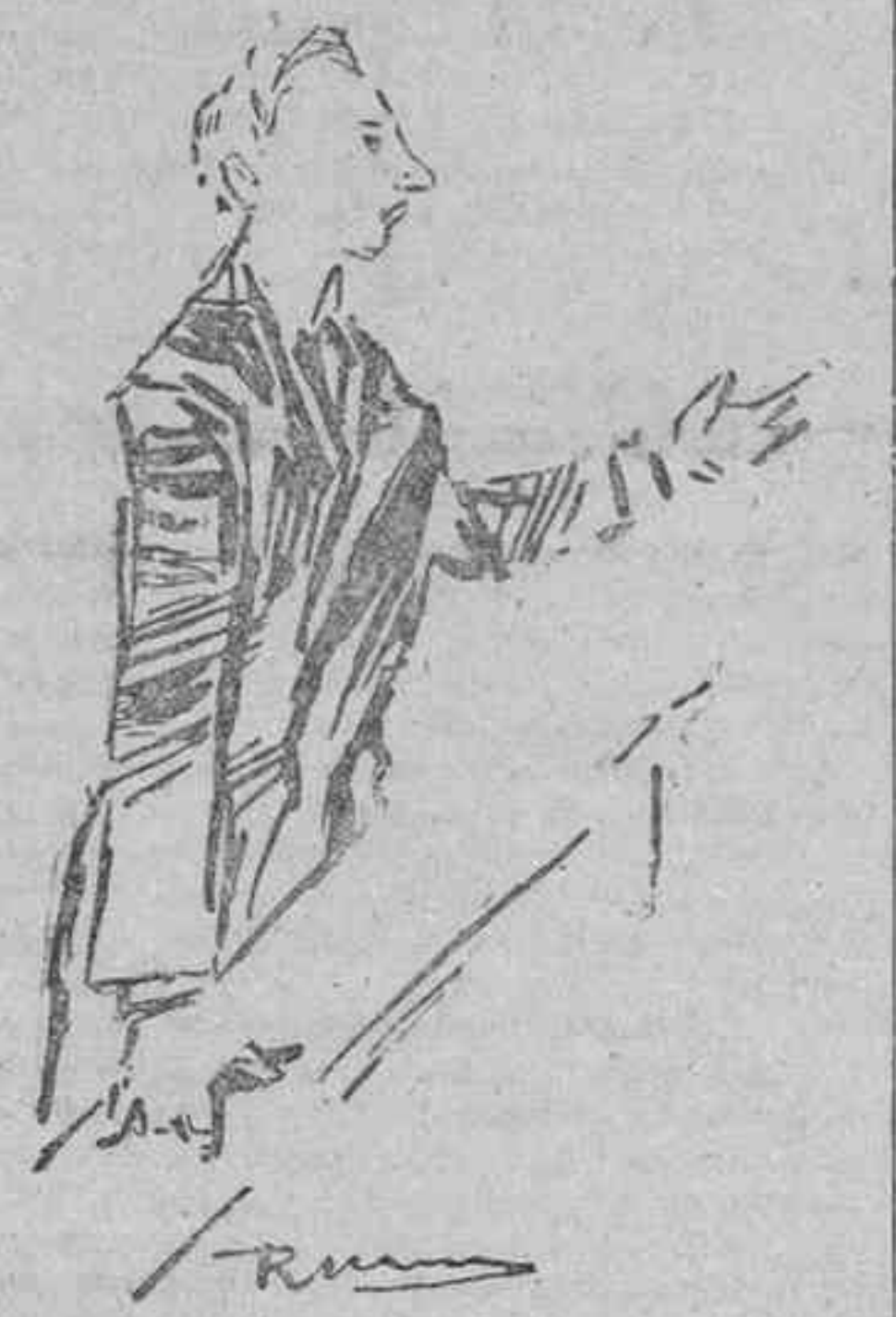
El ministro de la Guerra contestando a Nougés