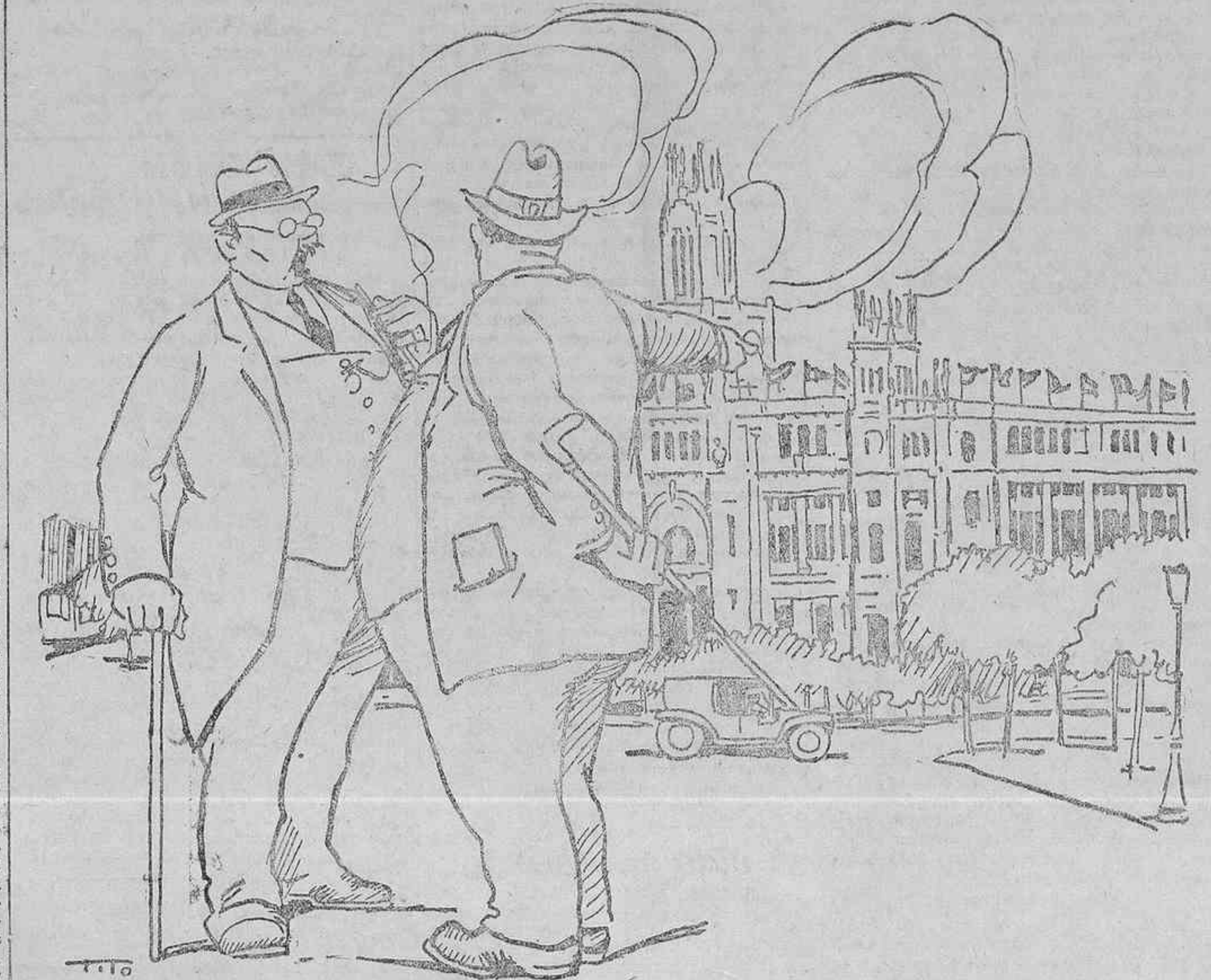
—Y todas esas banderas, ¿qué significan?... —Muy sencillo. Son las de los países a donde no llegan las cartas.

El ministro de Gracia y Justicia ha firmado ayer una real orden autorizando el funcionamiento de los Tribunales para niños en Tarragona.