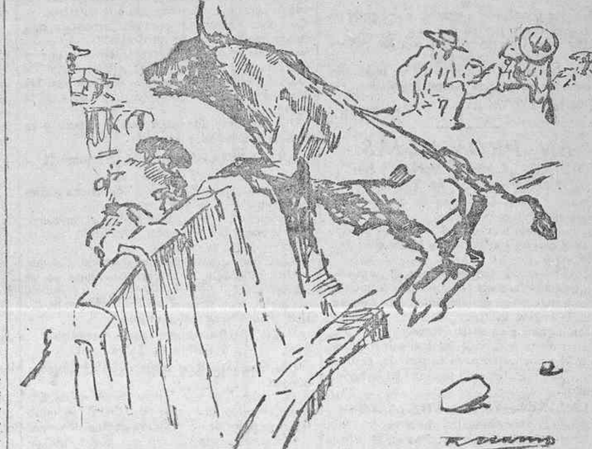
EL QUINTO TORO DANDO UN MORROCOTUDO SUSTO A LOS ESPECTADORES DE LA BARRERA