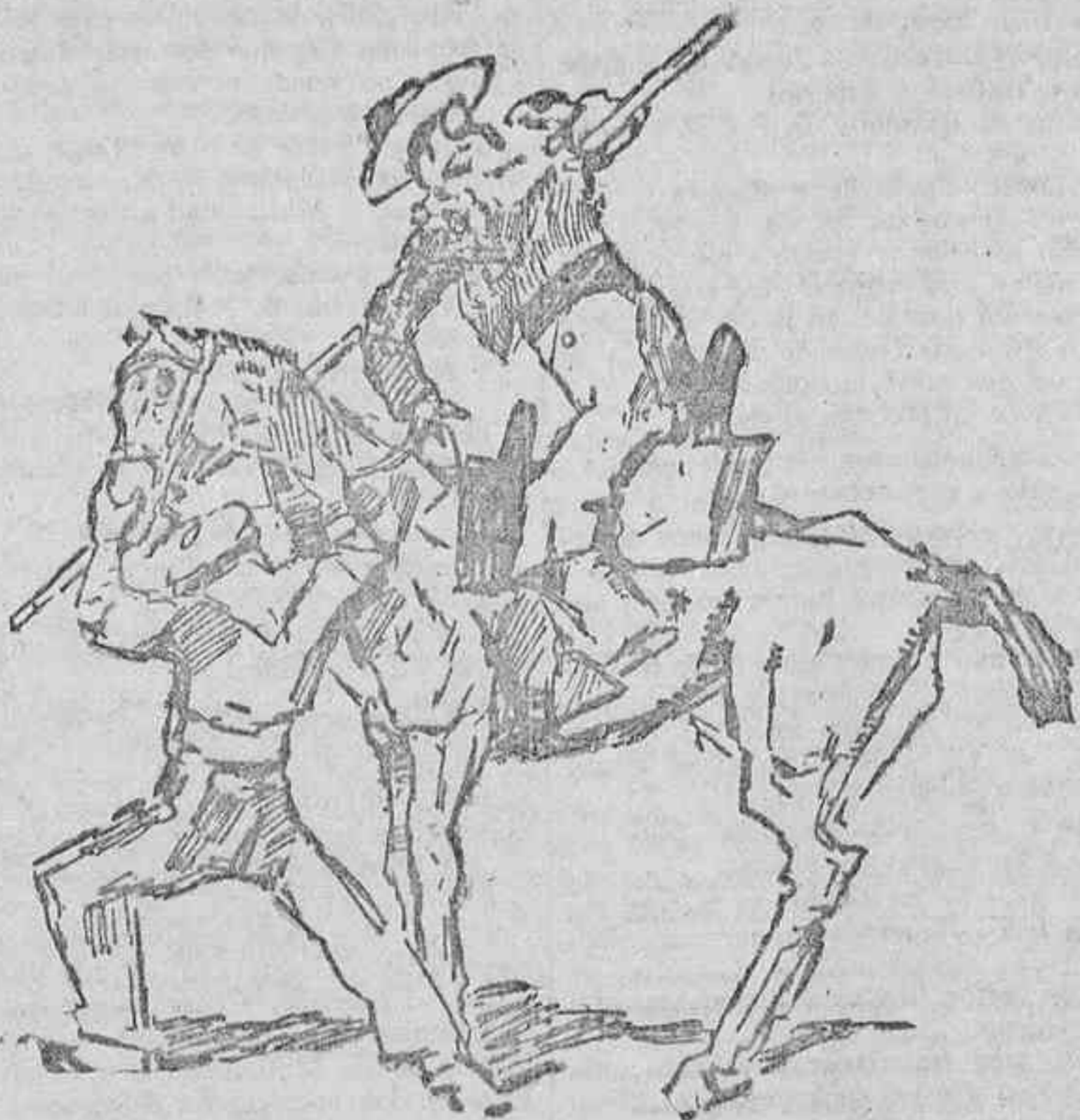
COMO SE ENTRÓ A PICAR AL CUARTO TORO