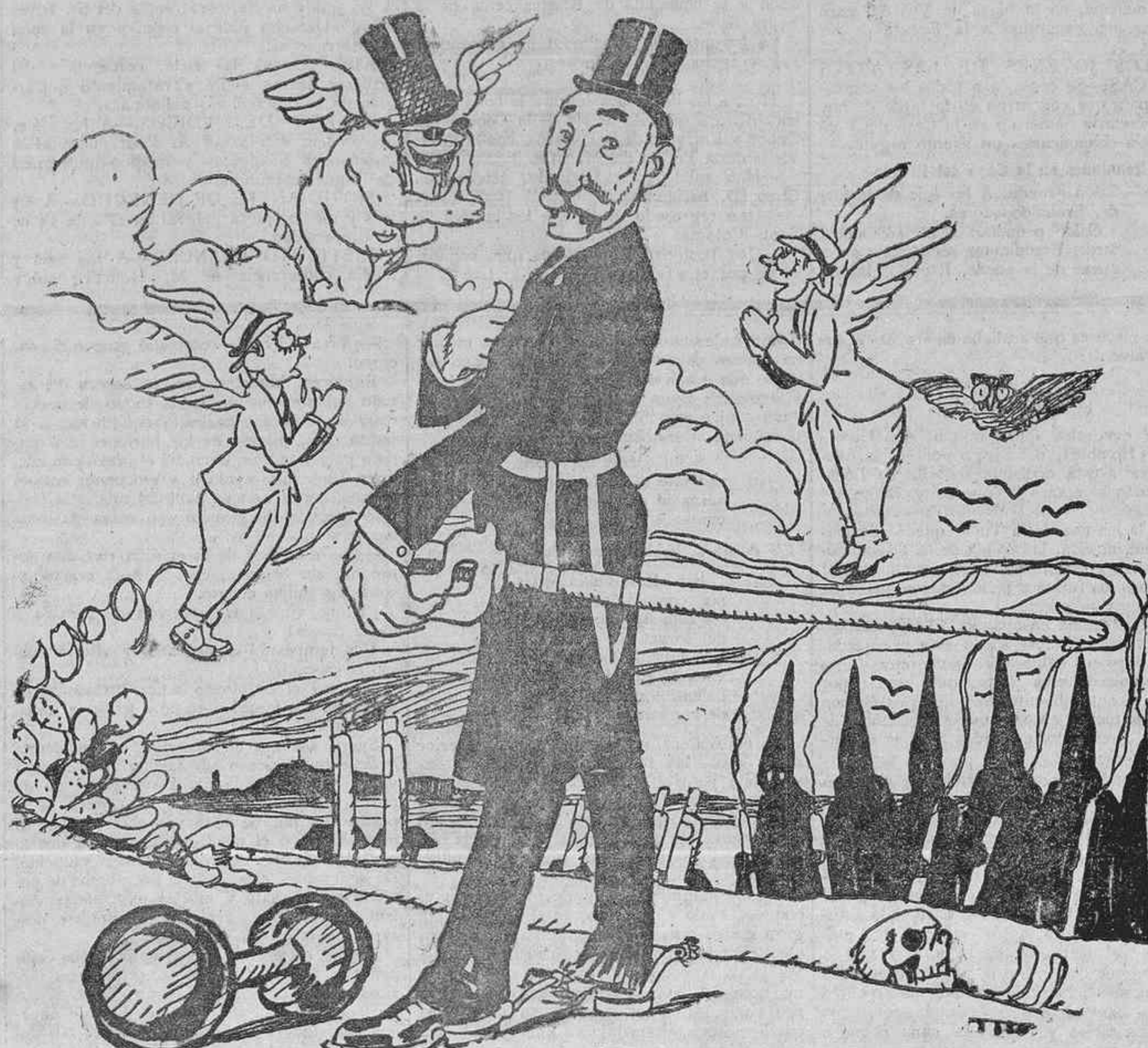
“El enemigo del pueblo.”