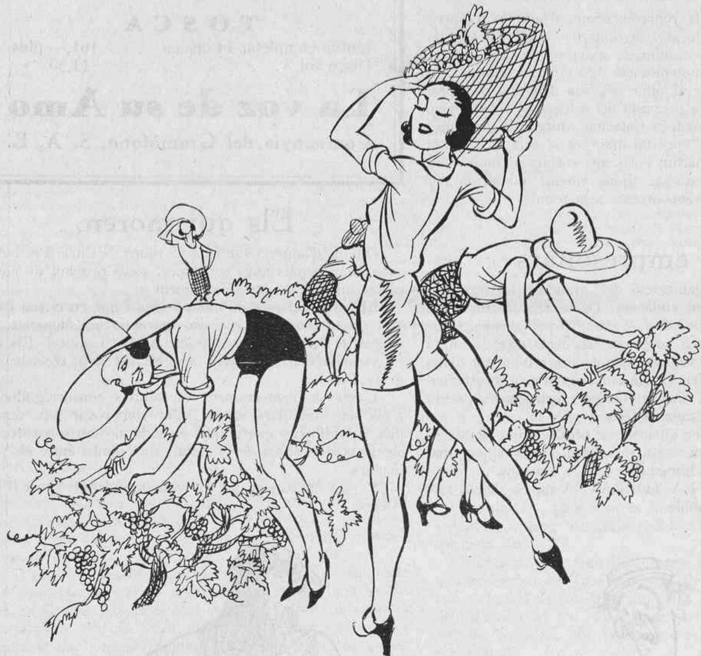
El raïm el cullen amb les mans...