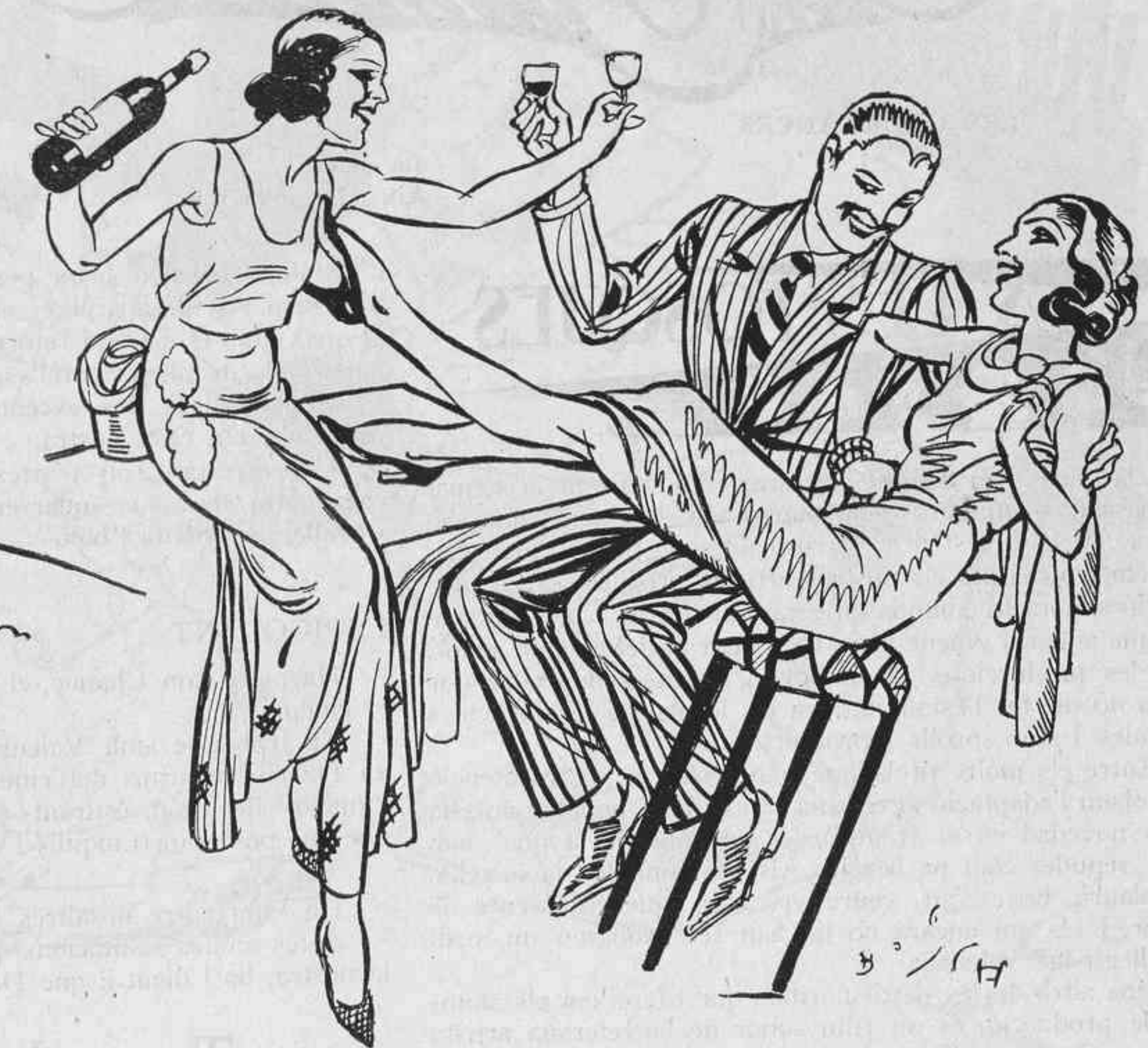
per fer-nos-el pujar al cap