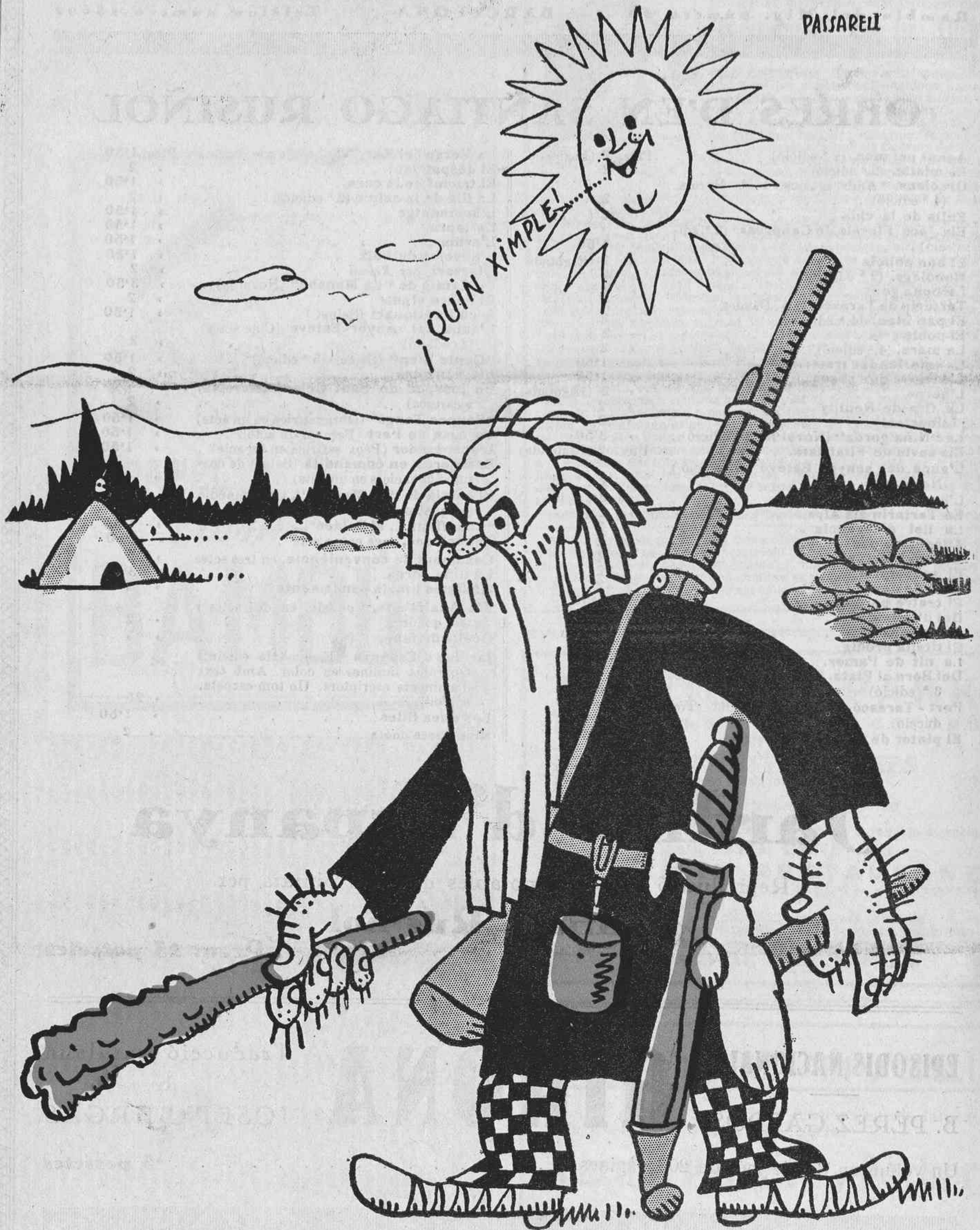
El famós Dr. Albiñana, disposat a regenerar el país amb el seu programa ultra-cavernari